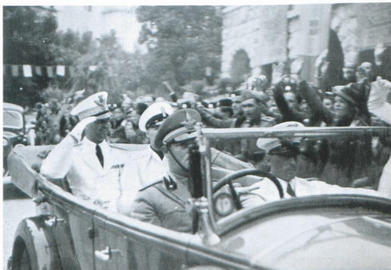
Slika 1. Princ Umberto Savoia u posjetu Opatiji 1938. godine