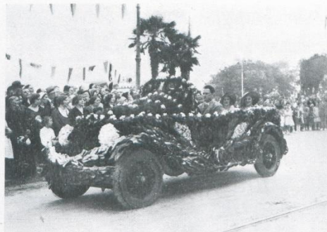
L'automobile del Cinquantenario (Nozze d'oro)