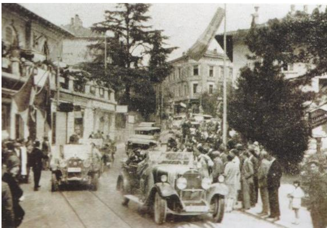
Slika 4. Povorka automobila kroz opatijsku glavnu prometnicu Corso Vittorio Emanuele III, 1930. godine