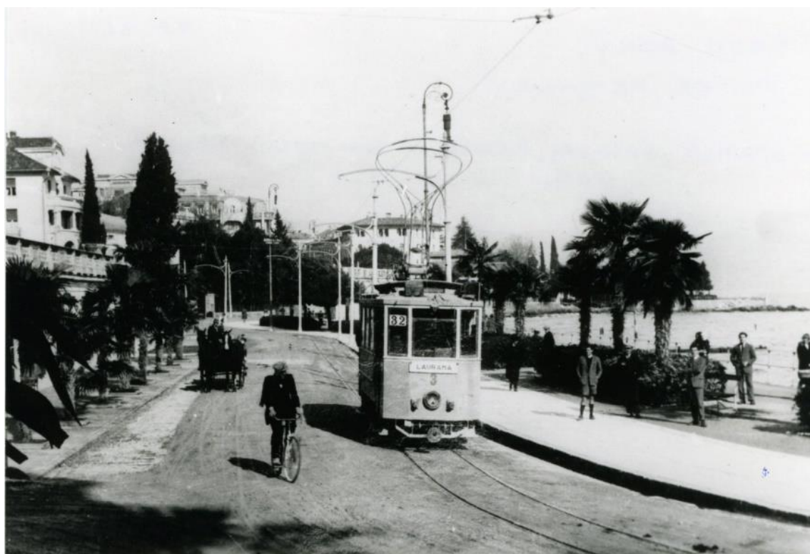
Slika 6. Opatijski tramvaj 1933. godine