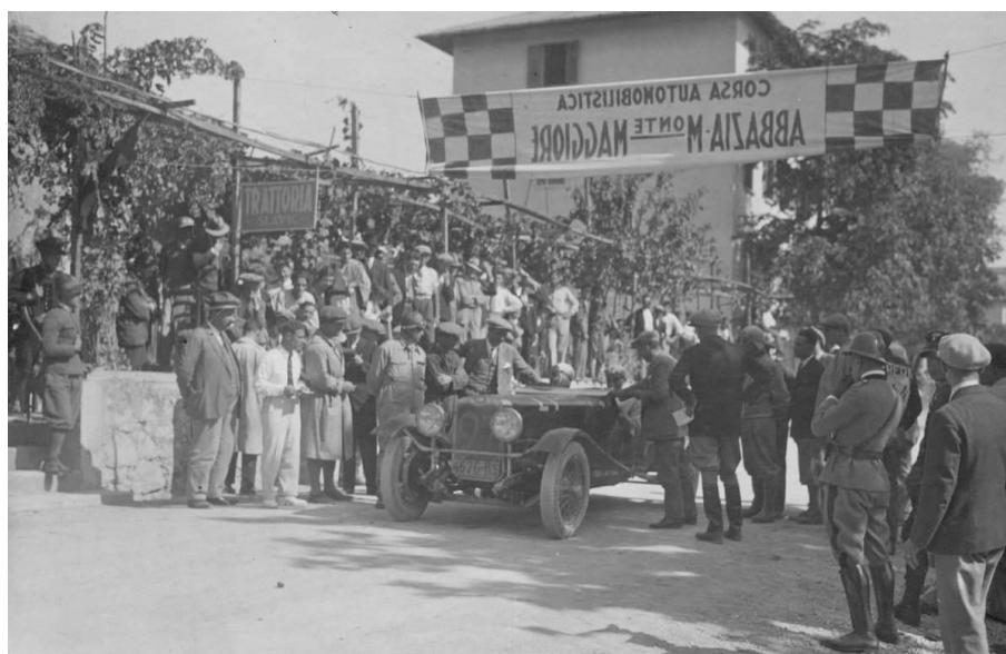
Slika 10. Automobilaska utrka Abbazia - Monte Maggiore 1929. godine