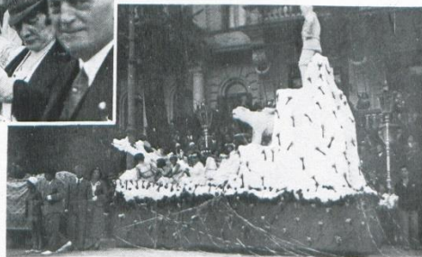
Slika 2. Manifestacija Cvjetni korzo u Opatiji