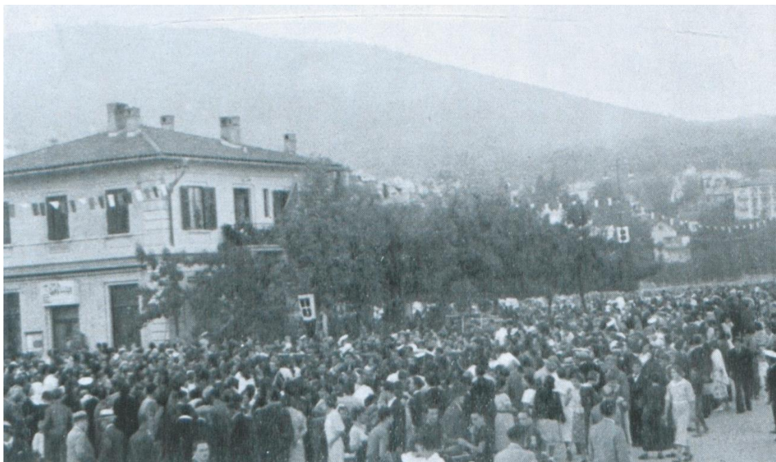
Slika 5. Okupljanje članova OND-a u opatijskoj luci 1936. godine