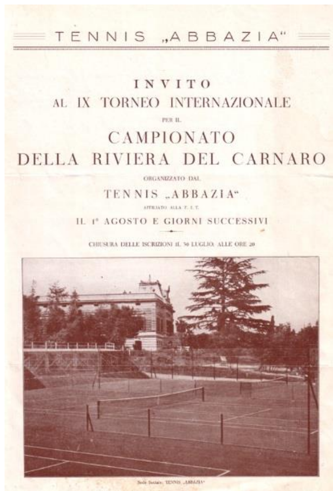
Slika 9. Međunarodni teniski turnir u Opatiji 1931. godine