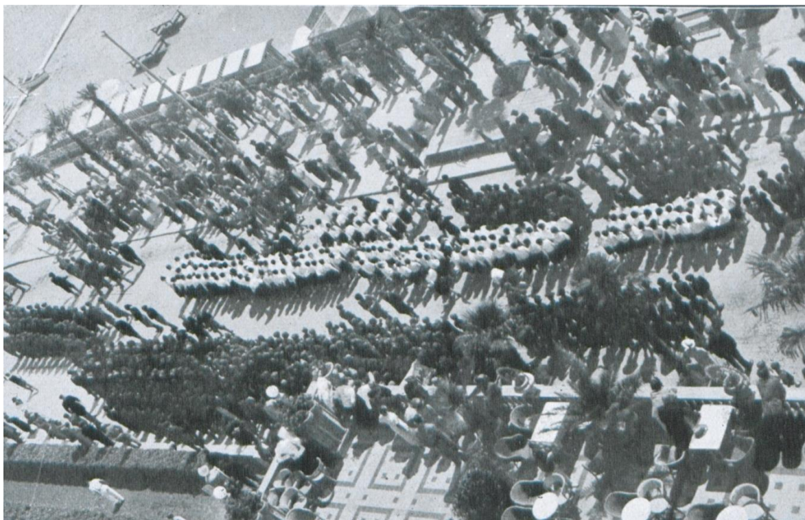
Slika 3. Patriotska manifestacija i okupljanje fašističke mladeži u Opatiji 1930-ih godina