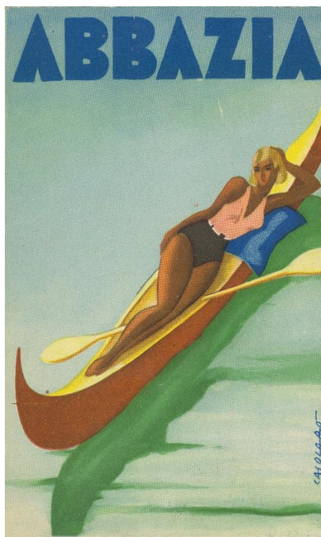
Slika 8. Turistički prospekt Opatije iz 1936. godine