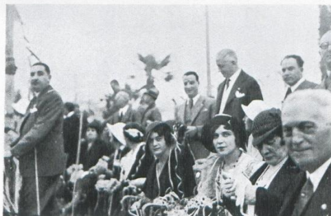
Nella tribuna delle autorità: un gruppo di gentili signore Auf der Tribune der Autoritäten: Eine Gruppe von Damen

Fra le autorità convenute nella tribuna d'onore c'era pure graditissimo ospite, S. E. Marescalchi Sottosegretario al Ministero dell'Agricoltura e delle Foreste con la figlia signorina Elisa.