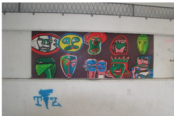
Slika 39. Pothodnik