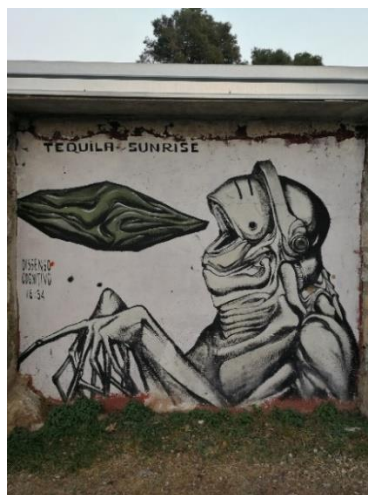
Slika 22. Dissenso Cognitivo – Punta Bajo