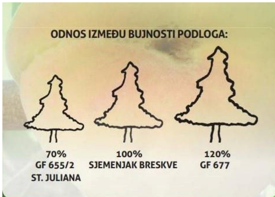
Slika 2. Odnos bujnosti podloga

ST. Juliana GF 655/2 je francuska podloga za šljivu i breskvu. Puno se prakticira kao podloga za breskve i nektarine s kojima ima dobru podudarnost. Prikladna je za uzgoj bresaka u gustom sklopu, a dobro uspijeva i na karbonatnim tlima. Vrlo je otporna na rak korijena i olovnu bolest. Sorte bresaka na ovoj podlozi imaju za 20 do 30% slabiju bujnost od običnog sjemenjaka breskve (Slika 2.) (Miljković, 1997.).