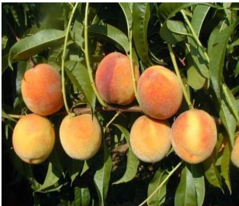
Slika 6. Sorta 'Redhaven'

navodi s obzirom da sazrijeva na sredini vremena dozrijevanja bresaka, uzima se kao standard za određivanje vremena dozrijevanja kod drugih sorti. Isti autor navodi da je vrlo zastupljena u uzgoju i ekonomski značajna sorta, navodeći kao razloge dobru otpornost na manipulaciju, transport i kvalitetu plodova. Vrsaljko (1999.) navodi da je ova sorta u području Ravnih Kotara pokazala najmanju osjetljivost prema pozebi. Medin (1998.) još dodaje da je u Hrvatskoj vodeća sorta u svim krajevima.