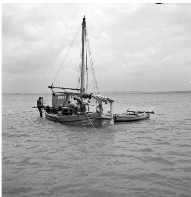
Slika 1. Fotografija leuta (brod lijevo) i kaića (manji brod desno) 2

Iako je Privlaka zbog svog geografskog položaja, ali i same činjenice da je poluotok poznatiji po ribarenju i pomorstvu, čemu u prilog ide i sabunjarstvo, valja naglasiti da su predci današnjeg stanovništva većinom bili stočari i ratari. Razlog tome je sastav tla te velike količine vode koje su i razlogom brojnih bunara u Privlaci. Vinogradarstvo je bilo uvelike zastupljeno kao i uzgoj mnogih ljekovitih biljaka (kadulje, smilja, gospine trave). Uz poljoprivredu i stočarstvo, zbog pogodnog morskog položaja, ali i mora bogatog ribom stanovništvo se sve više počelo okretati ribarenju (Mustać et al., 2011). Čovjekova potreba za izgradnjom prostora za život, gospodarskih zgrada i drugih jedinica je neupitna. Tako su u 19. stoljeću prvotni materijali kojima su se stanovnici Privlake koristili u svrhu izgradnje bili slama i glina, a postupno ih je zamijenio pijesak. Pojavom cementa za potrebe izgradnje pojavila se i potreba za pijeskom. Prve ideje o iskorištavanju pijeska i načinima vađenja počinju se javljati početkom 19. stoljeća pa se ovaj period može smatrati vremenom u kojem se ova praksa pojavila (Kolanović, 2000). Sabunjarstvo je, kao što je ranije navedeno, lokalni naziv za vađenje pijeska iz mora. Ovaj posao zahtijevao je osim snažnih i spremnih ljudi, specifične alate i prijevoz. U početku je bila riječ o manjim brodovima zvanim kaići , a kasnije su ih zamijenili veći brodovi- bracere i leuti .