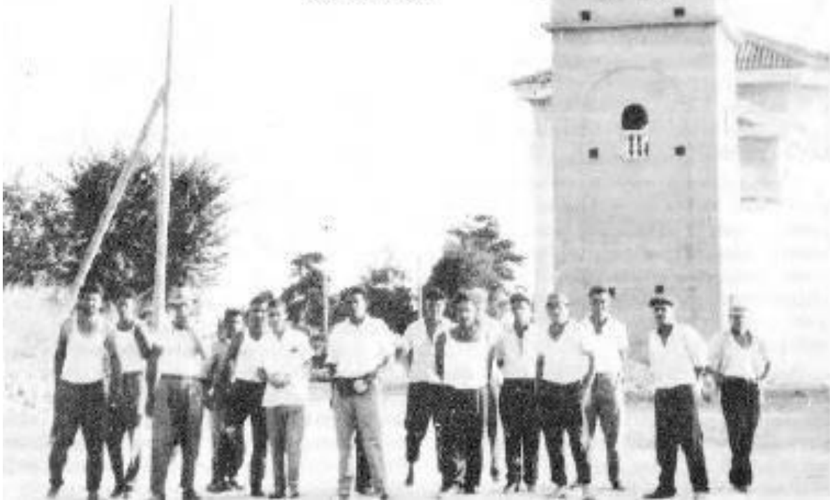
Slika 2. Pjesma Sabunjari autora Zdenka Brusića (Sokolar, 1995)