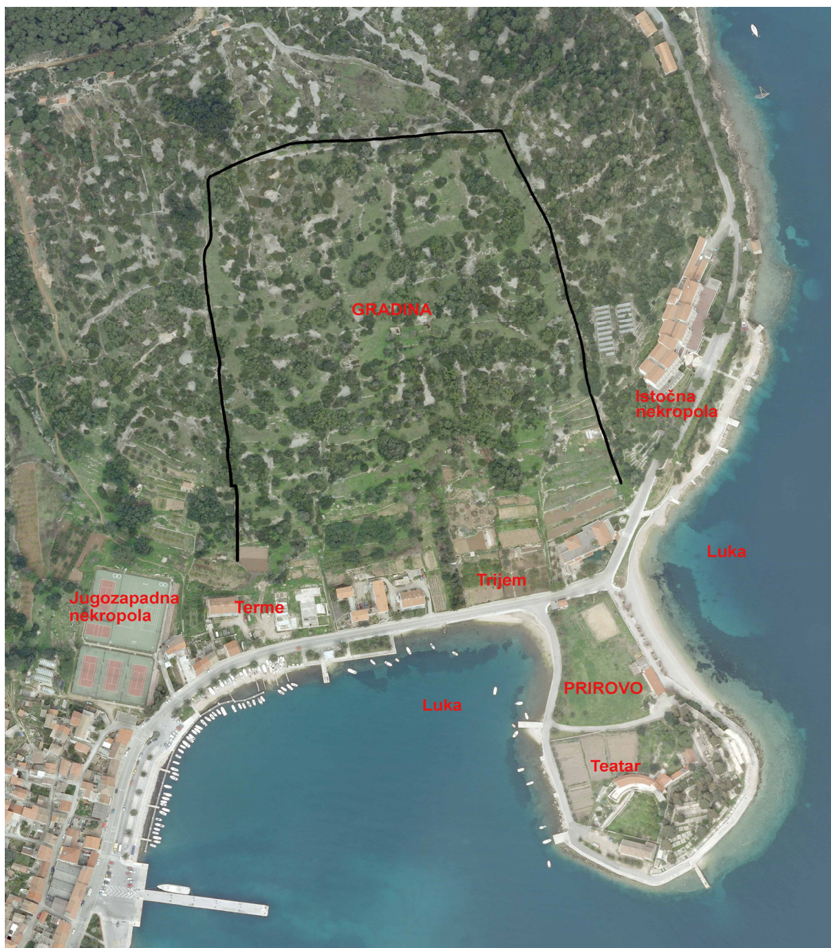
Zračni pogled na grčki grad Issu s označenim lokalitetima.