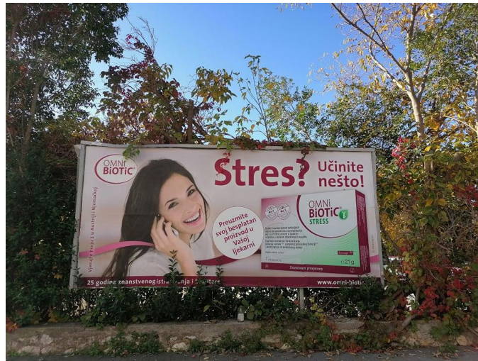
Slikovni prilog 2.

Slikovni prilog 2. Fotografija fotografirana u Zadru ispred trgovačkog centra City Galleria dana 8. studenog 2020.