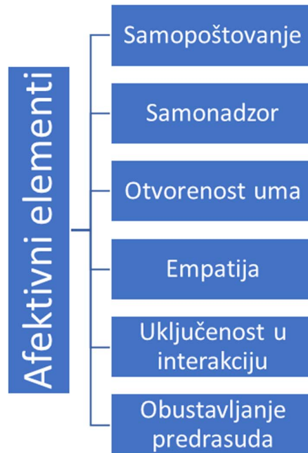
Slika 3. Afektivni elementi interkulturalne komunikacije (Chen i Starosta, 2000)

Pri izradi skale interkulturalne osjetljivosti, Chen i Starosta usredotočili su se na afektivne aspekte interkulturalne komunikacije, pri čemu je njihovo prvo istraživanje provedeno na 168 studenata prve godine komunikacijskih studija pomoću instrumenta koji je imao 73 tvrdnje. Tom su prilikom koristili peterostupanjsku skalu procjene Likertova tipa gdje je 5 označavalo „u potpunosti se slažem“, 4 „slažem se“, 3 „neodlučan sam“, 2 „ne slažem se“ i 1 „nimalo se ne slažem“. Nakon obrade rezultata, sve tvrdnje koje su imale ukupnu korelaciju veću od 0.50 prihvaćene su za istraživanje, dok su ostale odbačene. U drugom istraživanju skala je imala 44 tvrdnje umjesto prvotne 73. Cilj je bio definirati faktorsku strukturu te 44 tvrdnje. Istraživanje je provedeno na uzorku od 414 studenata među kojima je napravljena faktorska analiza rezultata. Dobiveno je 5 faktora: angažiranje, poštivanje kulturnih razlika, povjerenje prilikom interakcija, uživanje u interakcijama i svjesnost o interakciji. Krajnji broj tvrdnji smanjen je s 44 na 24. U trećoj fazi istraživanja, Chen i Starosta su svoju skalu usporedili s instrumentima koji imaju karakteristike slične njihovima, kao što su Skala pozornosti pri interakciji (Cegala, 1981), Skala samopoštovanja (Rosenberg, 1965), Skala samokontrole (Lennox i Wolfe, 1984) i Skala perspektivnog uzimanja (Davis, 1996), pri čemu su potvrdili značajnu korelaciju između svoje Skale interkulturalne osjetljivosti i svih spomenutih instrumenata (Drandić, 2013).