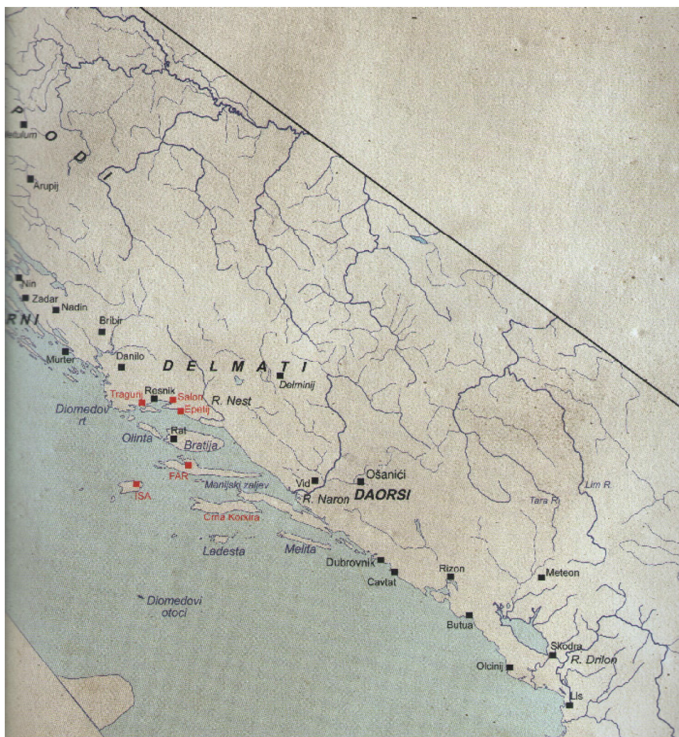
Karta 2. Grčka naselja, najvažnija arheološka nalazišta i grčki toponimi iz perioda klasičnog doba i helenizma (V. – I. st. pr. Kr) naznačena su na ovoj karti koju je kreirao Slobodan Čače

se, uz to što su proizvodile brojne vrste posuđa, tijekom III. i II. st. pr. Kr. farske radionice specijalizirale za proizvodnju amfora Faros 2 i Faros 3 tipa. Kao prepoznatljive proizvode farske radionice može se istaknuti i stolne amfore loptaskog tijela na širokoj nozi diskoidnog oblika ili na nižoj prstenastoj nozi, kojima su ručke dekorirane uzorkom lišća te olpe s jednom trakastom drškom čija se proizvodnja datira u kraj IV. i početak III. st. pr. Kr. 80