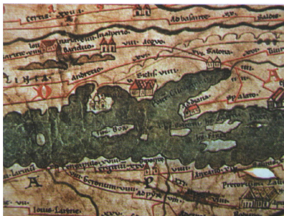
Karta 1. Oznaka naselja Siculi na Peutingerovoj karti (preuzeto iz: ŠUTA, I., 2011, 23.)

Postojanje rimskodobnog naselja na području Resnika bilo je pretpostavljeno zato što je Plinije Stariji prilikom opisivanja istočne obale Jadrana, u svom djelu Naturalis historia , nakon Trogira, naveo mjesto koje je nazvao Siculi . 62 Arheološkim istraživanjima, na položaju Resnik kod Kaštel-Štafilića, pronađeni su ostatci višeslojnog naselja. Ostatci ukazuju na to kako se radi o naselju Siculi o kojem je pisao Plinije Stariji, te je označeno na Tabuli Peutingeriani između Tragurija i Salone. 63 Iz teksta Plinija Starijeg može se dočitati kako su za vrijeme cara Klaudija na tom području naseljavani veterani. 64 Naselje Siculi imalo je status salonitanskog pagusa . Specifično je po tome što je to, prema informacijama iz pisanih izvora te s epigrafičkih spomenika, jedina zasad potvrđena dedukcija veterana na području provincija Dalmacije, Panonije, Mezije, Trakije, Makedonije i Ahaje, koja nije rezultirala osnivanjem kolonije. 65 Na Tabuli Peutingeriani , naselje Siculi , označeno je simbolom koji predstavlja veće naselje. 66 Na toj je karti naznačeno kako je naselje od Tragurija udaljeno V milja, a od Salone IX milja. 67