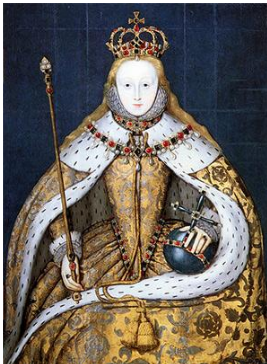
Slika 4. Elizabetina krunidba: History Today poveznica 5. rujna 2020.