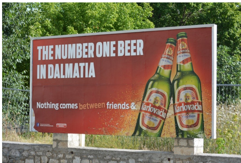
Slika 34. Reklama za hrvatsko pivo na engleskom jeziku (4.8.2013.).

razmišljanja jest pragmatičnost zbog koje nema potrebe stavljati tekstove na stranom jeziku izvan turističke sezone jer ih tada ionako nema tko čitati.