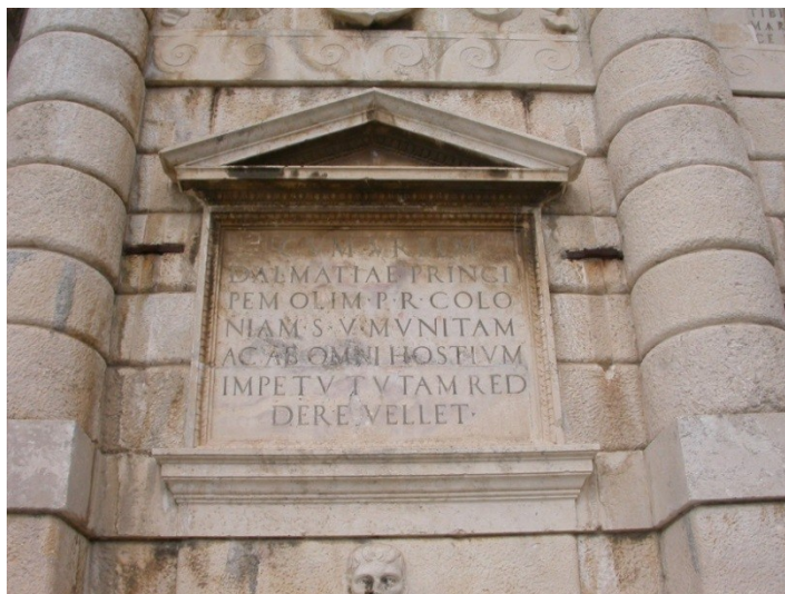
Slika 2. Latinski natpis na Kopnenim vratima (11.9.2011.)