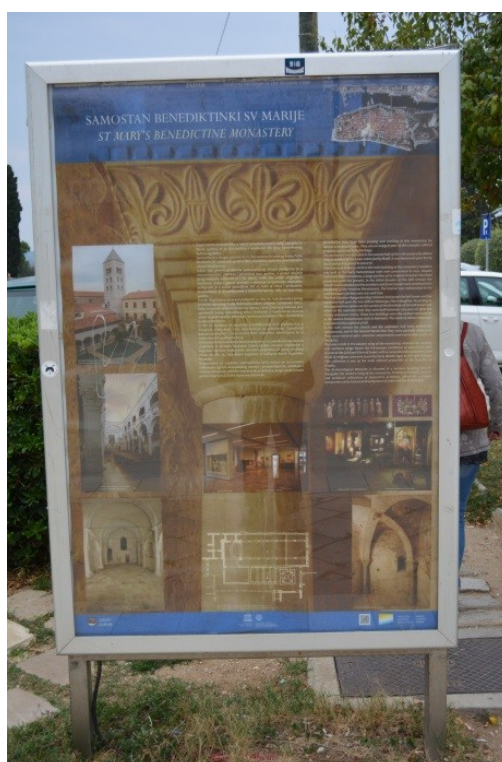
Slika 20. Informativni natpis o Samostanu sv. Marije na hrvatskom i engleskom jeziku (21.10.2018.)