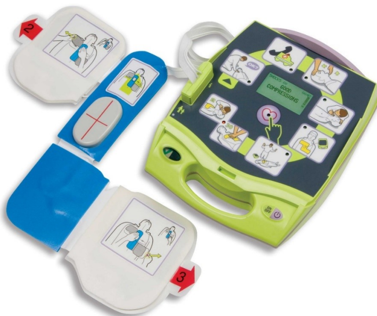
Slika 4. Automatski vanjski defibrilator ( http://www.aed.hr/osnovni-postupci-odrzavanja-zivota-primjenu-automatskog-defibrilatora/ )

Istraživanje Pettersen T. i suradnika nam opisuje kako medicinske sestre koje idu na predavanja i edukacije o provođenju kardiopulmonalne reanimacije jednom godišnje, provode pravilnije kompresije i pravilno poštuju smjernice za reanimaciju u odnosu na druge sestre. To nam govori kako se medicinske sestre moraju kontinuirano educirati u svezi provođenja kardiopulmonalne reanimacije, osobito sestre u sustavu hitnih službi i kardioloških odjela (24).