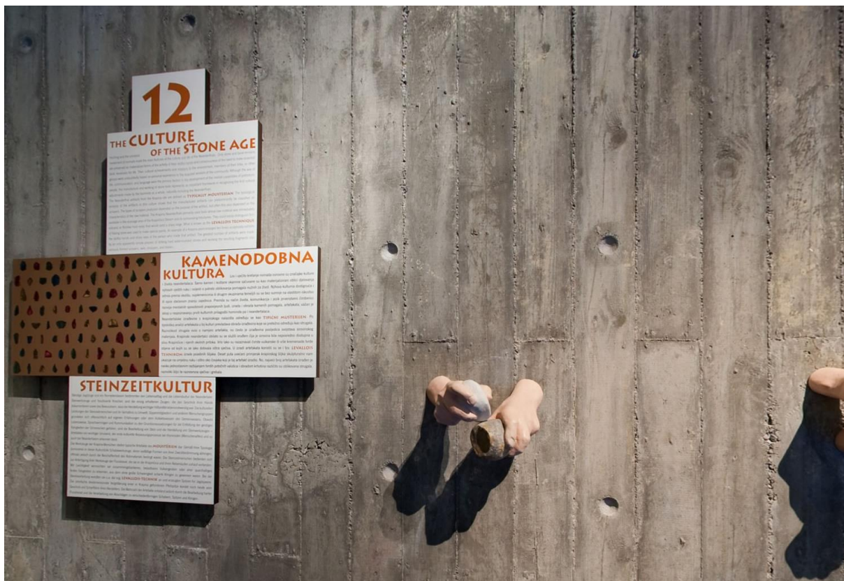
Abb. 3 Informationstafeln im Neandertalmuseum in Krapina

Aufgrund des mangelnden Platzes auf den Informationstafeln im Museum werden häufig Audioguides als Vermittler der ausführlicheren Informationen verwendet. In den nächsten Unterkapiteln wird der Audioguide im Kroatischen (AS) und Deutschen (ZS) anhand von den Übersetzungsstrategien und anderen Kriterien zum Aufbau des Audioguides analysiert.