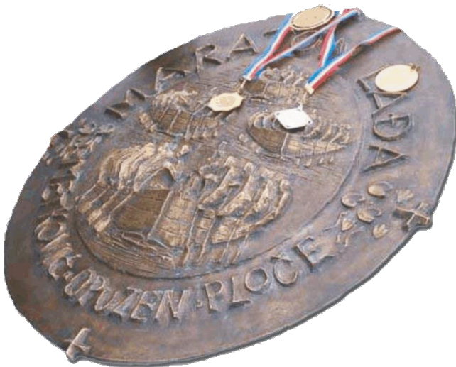
Slikovni prilog 3. Štit kneza Domagoja

Što je onda maraton lađa, kada i kako se održava? Maraton lađa je natjecanje koje se održava svake godine u kolovozu na relaciji Metković – Ploče dužoj 25 kilometara. Maraton se održava drugu subotu u kolovozu, osim prvog maratona, koji se održao u nedjelju 1998. godine (usp. Udruga lađara Neretve 7 ). Kako se lađa ne bi zaboravila grupa iz Vida je lađom veslala rijekom Norin i Neretvom, a njih je pratio i osnivač maratona lađa Milojko Glasović, ujedno i snimatelj i fotograf. On je došao na ideju maratona lađa kako lađa ne bi pala u zaborav te je on i osnivač maratona lađa. Prvi Maraton lađa održan je 13. rujna 1998. povodom obilježavanja sedme obljetnice akcije poznate pod imenom Zelena tabla – Male bare kojom je Hrvatska vojska preuzela vojarne JNA u Pločama (usp. Udruga lađara Neretve). 8 Po riječima Milojka Glasovića tu nedjelju je padala kiša sve do trena kada se maraton trebao veslati u 17 sati. Malo prije maratona je provirilo sunce i tako je ostalo cijelo natjecanje. Tijelo koje se bavi organizacijom maratona lađa je Udruga lađara Neretve, koja se sastoji od nekoliko udruga lađara. Kako se može pročitati na službenoj internetskoj stranici Udruge lađara Neretve prije maratona se svake godine održavaju brzinske utrke u Opuzenu, koje su borba za startne pozicije, te su ove brzinske trke uvelike značajne za prolazak same ekipe na maratonu. Skupina koja pobijedi na maratonu za nagradu dobiva štit kneza Domagoja, koji im se svečano uručuje na cilju u Pločama.