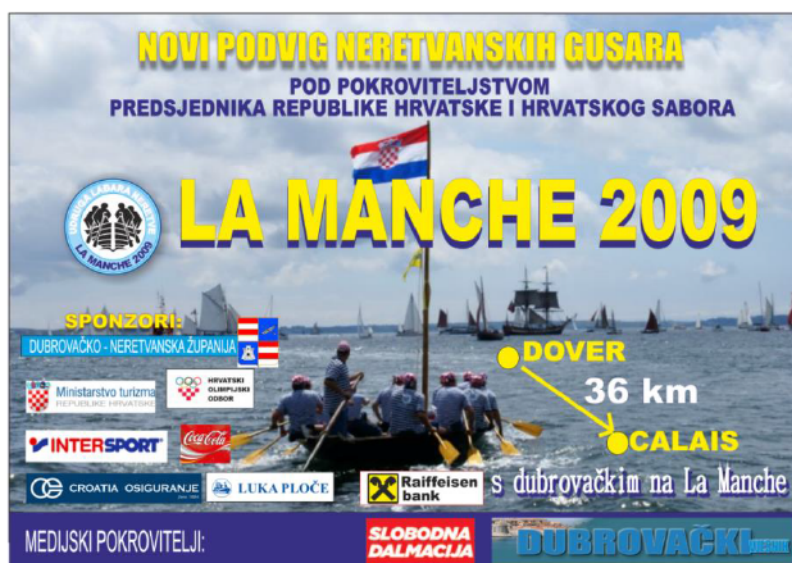
Slikovni prilog 5. La Manche

S lađom se preveslao Jadran, La Manche, veslalo se na Jarunu, posjećuju se Vinkovačke jeseni, lađa je bila u Francuskoj na sajmu brodovlja, a prema riječima predsjednika Udruge pokušava se organizirati da lađari s lađom posjete još nekoliko manifestacija, kako bi se za lađu i maraton više čulo.