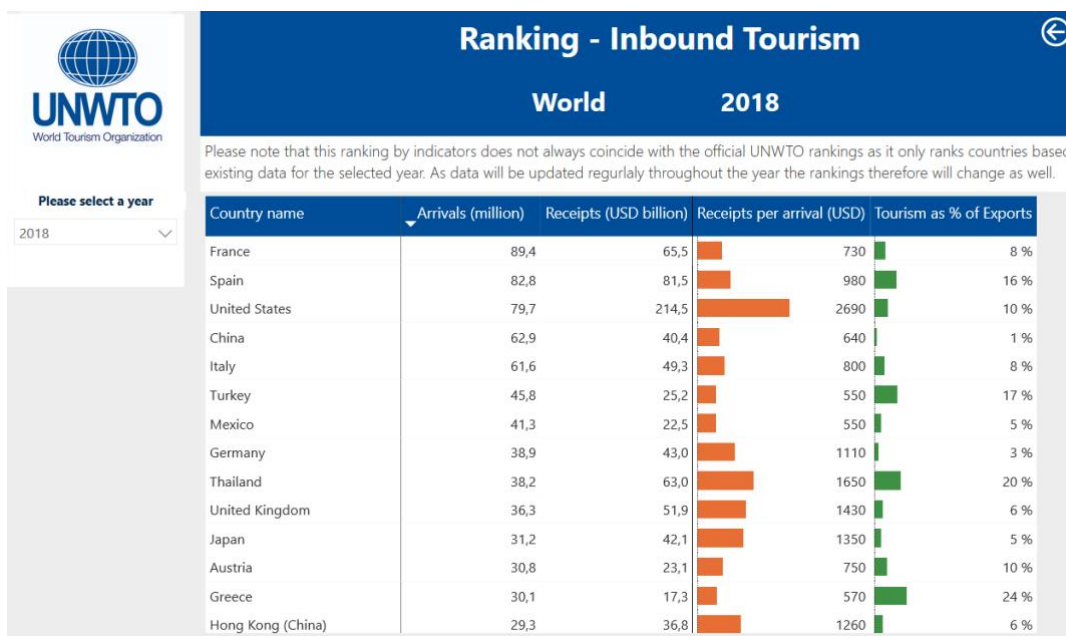
Slika 3. Rangiranje vodećih turističkih zemalja