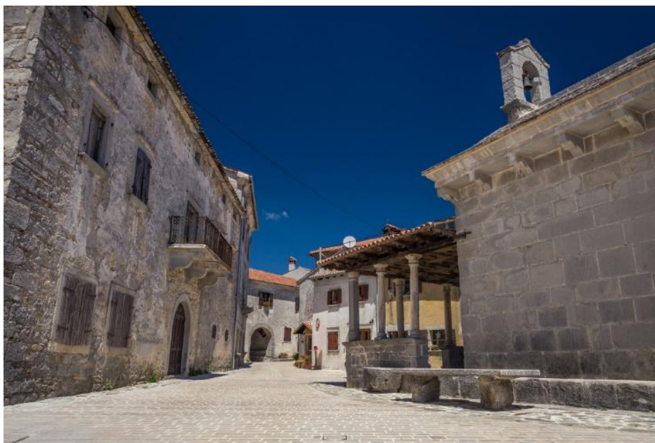
Slika 17. Gračišće - Plac

Zajednički naziv za više manjih zaselaka i sela unutar današnje općine Karojba, koji su smješteni sjeverno od ceste Karojba – Višnjan, predstavljaju Rakotule. Ondje se također može razgledati sakralna arhitektura poput Župne crkve sv. Roka, crkve sv. Blaža i crkve sv. Nikole iz 14. stoljeća sa širokim pogledom na prostranu dolinu Mirne. 48