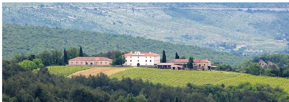
Slika 15. Ladanjski dvorac Belaj s pripadajućim vinogradima

Sjeveroistočno od Pazina, brežuljcima se proteže prostrana općina čije je središnje naselje Cerovlje, a u svom sastavu ima brojna manja sela i nekoliko ruralnih većih naselja: Grimaldu, Draguč, Paz, Gologoricu, Pazinske Novake, Borut itd. Ondje se nalazi obnovljen i valoriziran kaštel - ladanjski dvorac Belaj s arkadnim dvorištem, danas okruženim vinogradima, kojeg je u 17. st. sagradila plemićka obitelj Barbo, kao zamjenu za obližnji porušeni kaštel Posrt, čiji se ostaci također mogu razgledati. Današnje zajedničko ime za nekoliko manjih zaselaka sjevernije od Cerovlja je Borut. Ondje su osim brojnih agroturističkih domaćinstava i smještajnih objekata od nedavno na raspolaganju 2 pješačke staze kružne putanje: Staza svetog Kocijana duga 4-13 km i Staza svetog Silvestra (5-15 km). Paz je nekadašnje središte zasebne feudalne gospoštine koja je imala sjedište u kaštelu čiji se ostaci vide i danas na uzvisini ponad naselja. 42 Na ovom se području redovno godišnje održavaju manifestacije: Karneval u Cerovlju, Supci pod mavricun u Grimaldi, Dan vina u dvorcu Belaj, Dan Općine Cerovlje, pučka fešta Oldrešova u Pazinskim Novakima i Vela sv. Marija u Cerovlju. 43