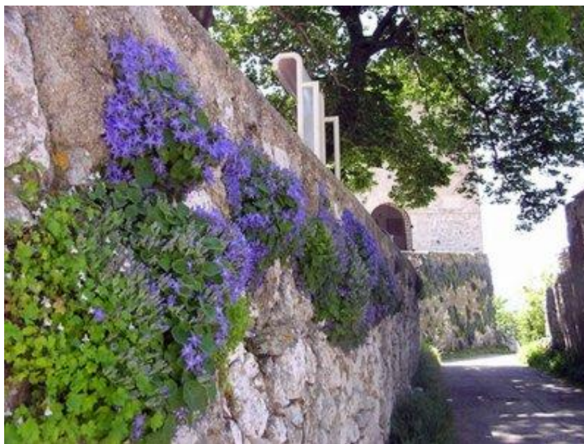
Slika 13. Istarski zvončić, česti stanovnik kamenih zidina

Sve navedene atrakcije privlače lokalne i strane zaljubljenike u prirodu i avanturu, te upotpunjavaju bogatu spomeničku baštinu o kojoj više riječi slijedi u nastavku.