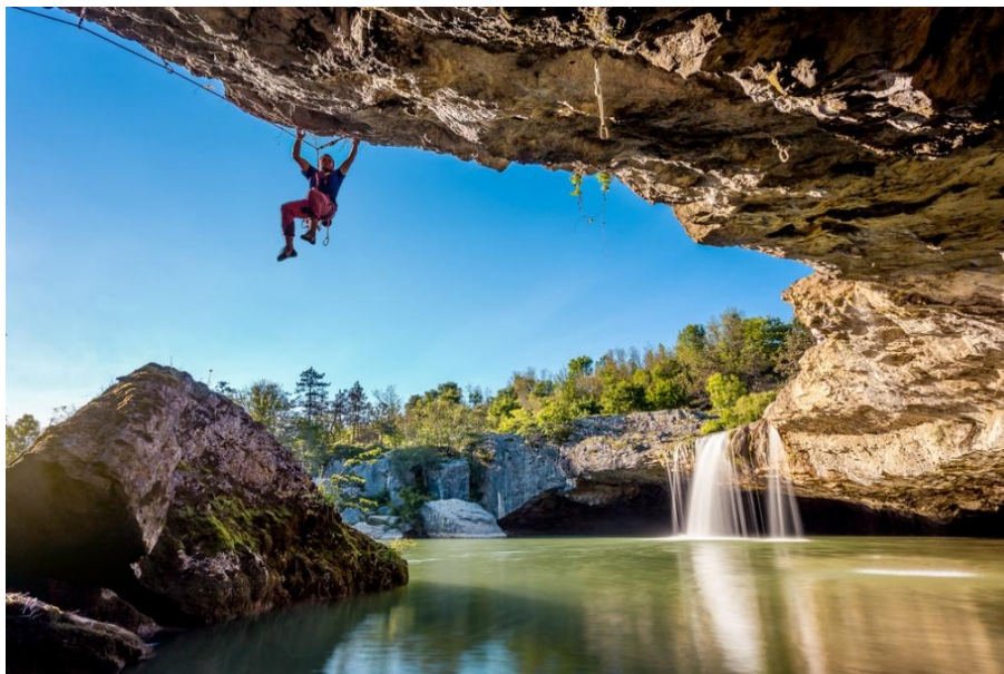
Slika 11. Kupalište i penjalište Zarečki krov

Najveća i najpoznatija jezera nalaze se duž općine Cerovlje gdje je dopušten i robolov te kupanje. Samoprovano gradsko kupalište grada Pazina nalazi se 2 km izvan grada i to također na raznim jezerima Pazinčice, a posebice slapovima Zarečki i Pazinski krov gdje je ispod slapa opremljeno i malo penjalište za slobodno i sportsko penjanje. Jedan od svakako najposjećenijih i najljepših vodopada središnje Istre je slap Sopot u blizini mjesta Gračišće.