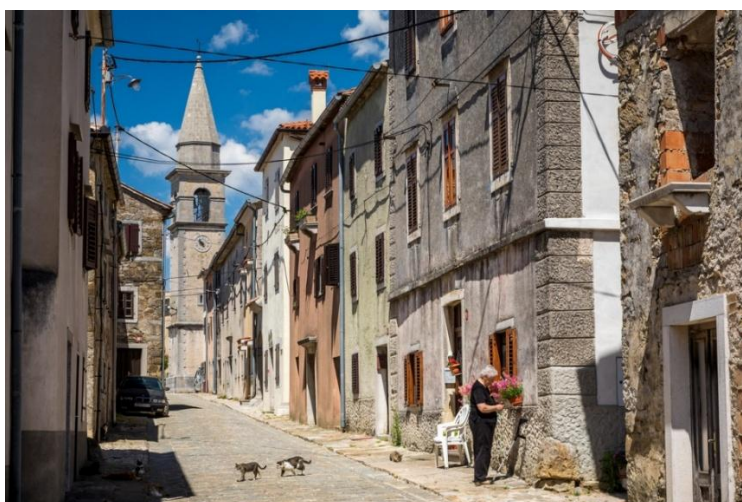
Slika 16. Draguč