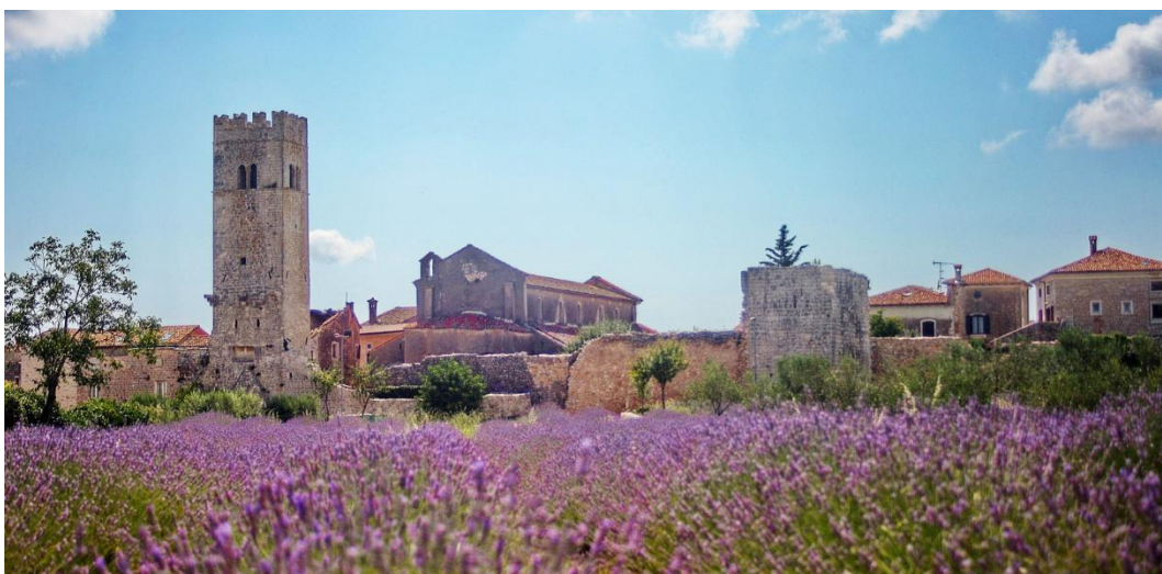
Slika 21. Sveti Lovreč

Pregledom svih atrakcija središnje Istre stiže se i do posljednjeg mjesta i općine - Tinjan, koji je vječno bio granica između raznih vladara obalne i unutrašnje Istre. Tinjan danas predstavlja sredinu koja čuva svoju tradiciju i povijest, bilo da se radi o legendama i predajama, graditeljskom i folklornom nasljeđu, ili pak o gastro-delicijama vrhunske kvalitete poput istarskog pršuta. U Tinjanu se može razgledati okrugli kameni županski stol oko kojeg su zasjedali župani i suci, centar mjesta koji je nekada imao gradska vrata i pokretni most čiji se ostaci još mnogu vidjeti, nekadašnja gradska loža, barokna kuća Depiera, kasnobarokna župna crkva Sv. Šimuna i Jude Tadeja, stara škola Casamara i romanička crkvice sv. Križa iz 13. stoljeća. Turistima je posebno zanimljivo što svakim korakom Tinjanštine mogu vidjeti prastare kažune i suhozide, a od 2013. otvorena je i zbirka sumještanina Enrika Depiera koja obuhvaća više tisuća predmeta vezanih uz rad i život Tinjanaca kroz povijest. 61 Kako je Tinjan 2006. godine službeno proglašen Općinom istarskog pršuta, upravo na tome se bazira i većina