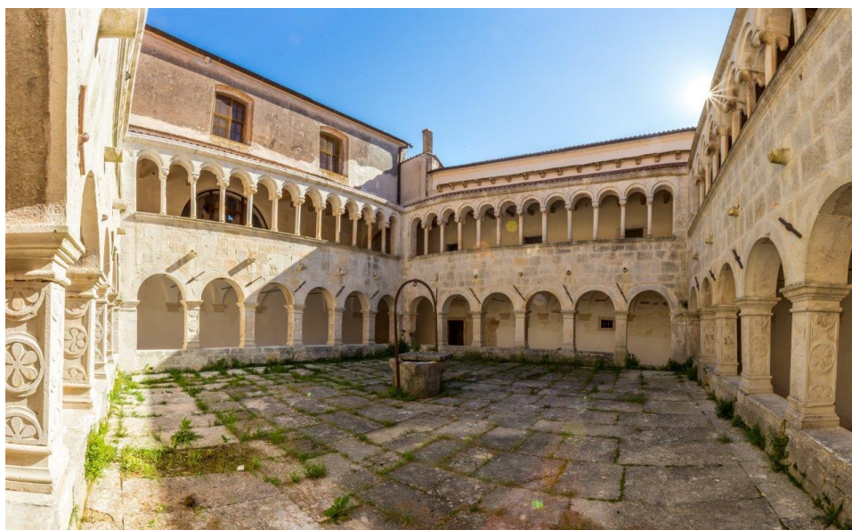
Slika 20. Benediktinski samostan, Sveti Petar u Šumi

Sveti Lovreč nalazi se na potezu iz Poreča i Vrsara prema unutrašnjosti te predstavlja jedan od najočuvanijih primjera utvrđenih srednjovjekovnih istarskih gradova. Ime naselja dobiveno je prema crkvisci svetog Lovre iz 13. stoljeća, a kružni oblik naselja utemeljen je još u prapovijesti kada se na istoj uzvisini nalazila gradina. U doba Bizanta u Svetom su Lovreču utvrđeni bedemi i kule koje su se kasnije u nekoliko navrata temeljno obnavljale, a najbrojnije danas vidljive fortifikacije potječu iz doba Venecije. Neke od glavnih atrakcija Svetog Lovreča su