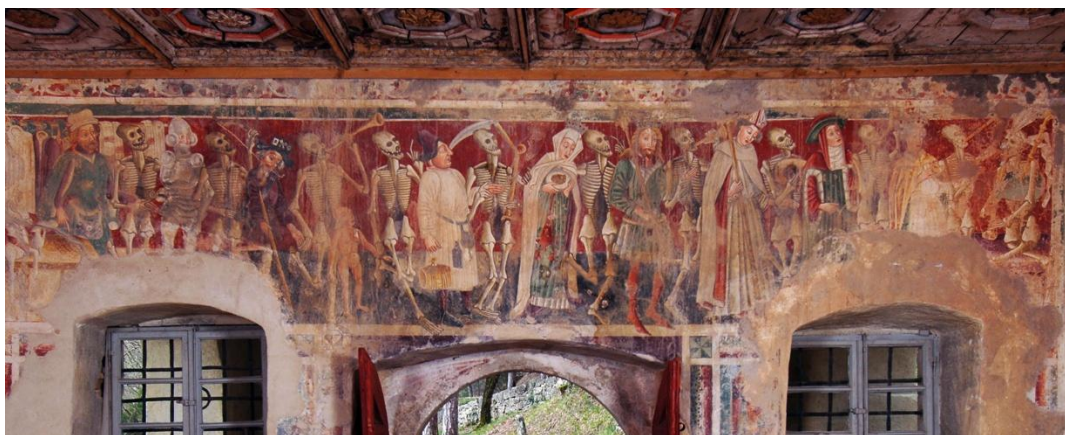
Slika 14. Ples mrtvacu, crkva sv. Marije na Škriljinah

Mjesto Boljun smješteno je vrhu jednog brežuljka, sa širokim pogledom na planinski masiv Učke i plodnu dolinu Boljunčice podno nje. Ondje je posjetiteljima posebno zanimljivo nekoliko objekata. To su crkva Sv. Kuzme i Damjana, te crkva Sv. Fabijana i Sebastijana, obje iz 12.