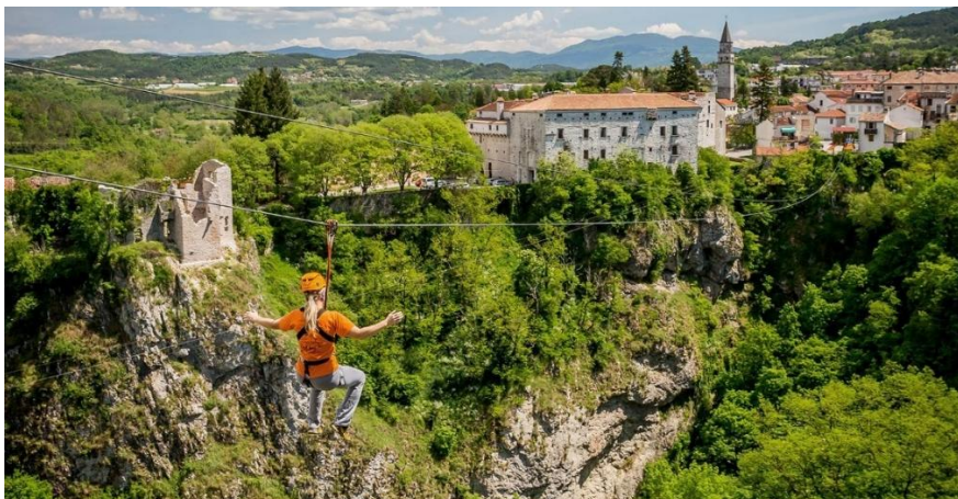
Slika 10. Pazinska jama i zip-line s pogledom na Pazinski kaštel

Također je dobro poznato da je na prostoru Istre tlo “šuplje” pa se tako u središnjoj Istri nalaze brojne spilje i jame koje turisti također redovno posjećuju. Najpoznatija, o kojoj je pisao i Jules Verne je svakako Pazinska jama preko koje je prije nekoliko godina otvoren zip-line te rope jump. Jamu se također može posjetiti i iznutra i to u obliku speleoavanture. Pazinski ponor zaštićen je zakonom i proglašen je važnim krajolikom, a obuhvaća ponor Pazinčice i njezin kanjon, te naravno Pazinsku jamu. Jama je zapravo ponorište rijeke Pazinčice, a duž čijeg se nadzemnog toka mogu naći brojna jezera, slapovi i kupališta.