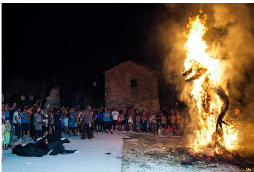
Slika 19. Uprizorenje legendi na LegendFestu, Pićan

U Istri je Pićan široko poznat kao gradić legendi, a sigurno je bio naseljen još u dalekoj prapovijesti. Najstarije dijelove histarske gradine može se naći na brdu Kalvarija sjeverno od današnjeg naselja, a nakon Histra, u Pićnu je živjelo keltsko pleme Secusa. U doba rimskog carstva ondje se nalazilo vojno uporište i naselje. Posebno popularne legende tog mjesta su Legenda o svetom Niceforu mučeniku te Legenda o svetom Niceforu biskupu i trnoplesarima. U Pićnu posjetitelji mogu razgledati crkvicu Sv. Roka, zaštitnika od kuge, monumentalna gradska vrata sagrađena u 14. stoljeću, a obnovljena 1613., zatim biskupsku palaču i rodnu kuća Matka Brajše Rašana, te župnu crkvu Navještenja Blažene Djevice Marije iz 18. stoljeća i jednobrodnu romaničku crkvicu Svetog Mihovila iz 13. stoljeća. 55 Kako je već na početku spomenuto, Pićan je mjesto legendi pa se tako i većina manifestacija ondje oslanja upravo na njih. U Pićnu se svake godine slave Petivina i dan Pićanaca, Legenda o Trnoplerasima, LegendFest - festival legendi, priča i mitova Istre, Štrigarija uživo, te pučka fešta Rokova. 56