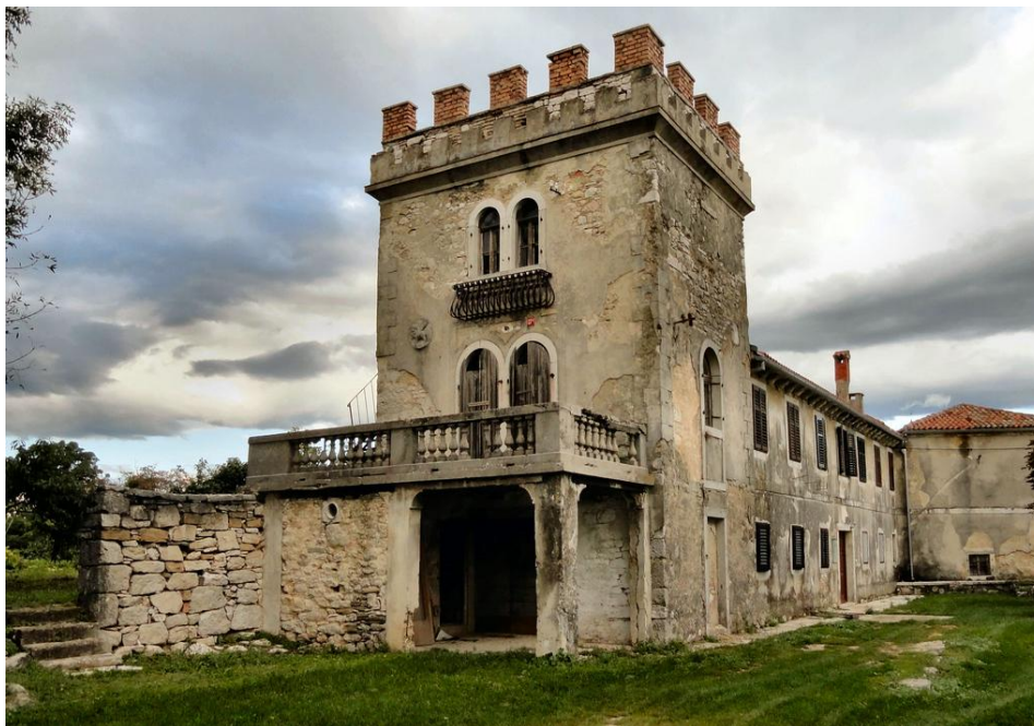
Slika 18. Villa Baxa, Lindar

Šumovito područje zaleđa Karojbe, oko izvora Vručak i Valigaštar, prepuno je još uvijek slabo istraženih povijesnih lokaliteta. Na mjestu nekadašnje rimske nekropole, a na današnjem također karobljanskom groblju, nalazi se crkva sv. Andrije. Ispred ulaza na groblje može se vidjeti sačuvani sarkofag iz rimskog razdoblja, te je od rimskog nadgrobnog spomenika izrađen također i nadvratnik crkve. U Karojbi posjetitelji mogu pješaćiti Putem Istarskog razvoda - tematskom stazom opremljenom s nekoliko interpretacijskih panoa na 4 jezika, čiji je početak kod kapelice Gospe Lurdske, a šetnja vodi polaznike u razdoblje srednjeg vijeka. Put Istarskog razvoda trajao je 21 dan tijekom kojih su se utvrđivale sporne međe između predstavnika vlasti i lokalnog stanovništva. 52 Što se tiče kulturno zabavnih manifestacija, u Karojbi se svake godine slavi pučka fešta Petrova, zatim u mjestu Pilati fešta sv. Marine, Škropečanska fešta u Škropetima, u mjestu Trviž održava se pučka fešta Rožarova, Večer hrvatskih klapa i Istra Off Road utrka. 53