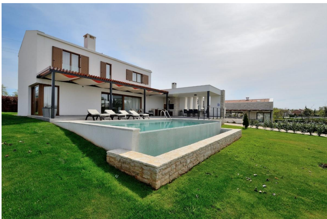
Slika 6. Vanjski prikaz moderne kuće za odmor

Neki se iznajmljivači ipak odlučuju na izgradnju nove kuće iz temelja ili prenamjenu stare u potpuno modernom i minimalističkom stilu. U tom slučaju, njihovi eksterijeri i interijeri najčešće izgledaju ovako: