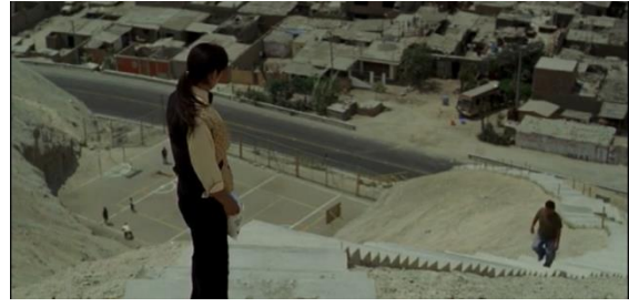
Fotografía 2. Lima

Las costumbres de los indígenas acerca de las bodas aparecen como otra característica del indigenismo en la película. Aunque viven en miseria y no tienen bastante dinero, las bodas tienen que ser lujosas. Se invita a mucha gente, se baila mucho y se compran los regalos. Una costumbre bastante interesante es que la novia tiene que pelar la patata de una vez y si lo hace bien, su vida sería larga y buena, justo como dice el padre de Máxima o tío de Fausta: Será una vida larga, llena de amor y esperanza.