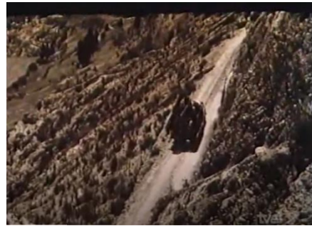
Fotografía 11. El altiplano

El mismo Sanjinés dijo sobre esta película que es su primera película antimperialista, que trata del conflicto entre los pueblos oprimidos y su enemigo (Sanjinés: 95-96):