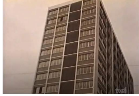
Fotografía 9. Los edificios de la ciudad