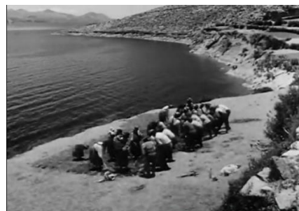
Fotografía 5. Trabajo colectivo en el campo