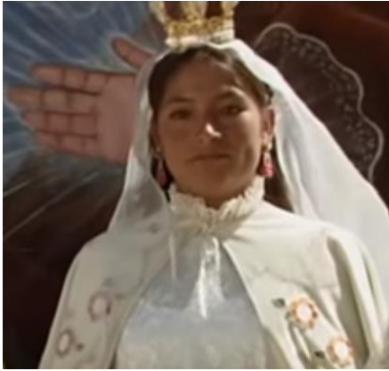
Fotografía 5. Madeinusa como la Virgen María