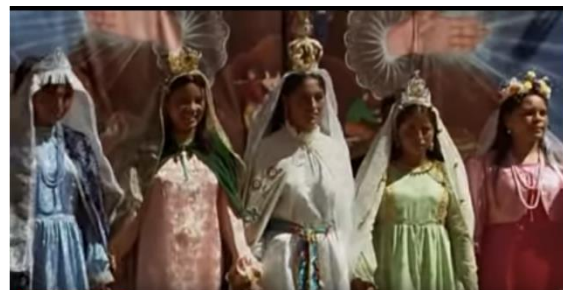
Fotografía 2. Las adolescentes vestidas como Virgen María

Otra característica del indigenismo es el ambiente de la película, ya que fue filmada en los Andes peruanos, así que se trata de un ambiente real del Perú. La directora dijo lo siguiente acerca del pueblo y del ambiente de la película: “Madeinusa, por su parte, recurre a la tradicional imagen del pueblo aislado que vive en su propio ritmo” (Vilanova, 2014: 348).