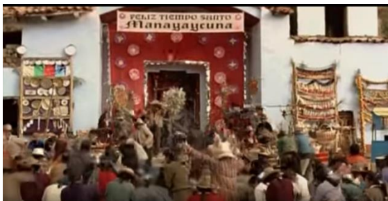
Fotografía 1. La festividad de Tiempo Santo en Manayaycuna

La directora dijo sobre esa película: “Creo que una de las grandes cosas que consiguió ‘Madeinusa’ es que se hable de temas que están subyacentes al imaginario colectivo de este país, y quieran o no, están ahí”. 23