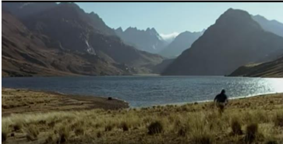
Fotografía 3. Los Andes peruanos

, son percibidos como sujetos de su propia historia” (2014: 349).