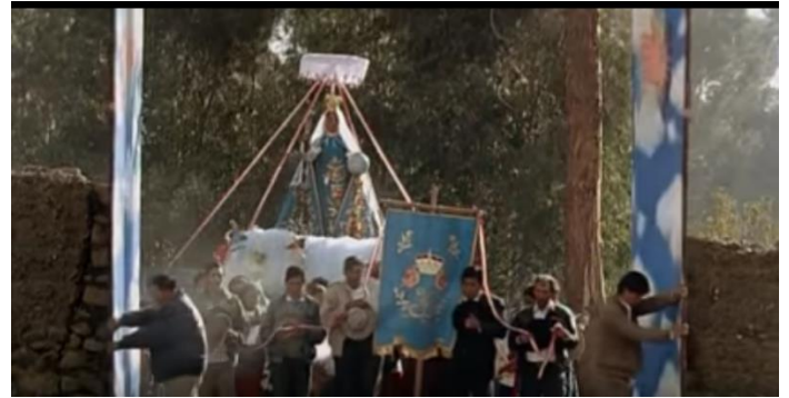
Fotografía 6. Los hombres llevan la Virgen María (Madeinusa) por todo el pueblo

El tema del incesto durante esta festividad aparece como algo normal y aceptado por todo el pueblo. Madeinusa tenía que protegerse de otros hombres y experimentar la relación sexual con su padre. Pero ella hizo lo contrario, su primer hombre fue el Gringo, el extranjero de Lima. Vilanova dice que “Madeinusa está destinada a perder su virginidad en los brazos de su padre, que se la autorregala como botín al que tiene derecho durante el Tiempo Santo” (2014: 349).