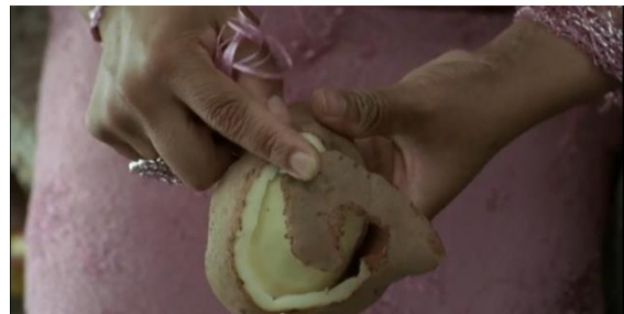
Fotografía 4. La novia pela la patata