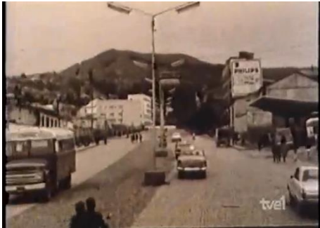
Fotografía 10. La ciudad