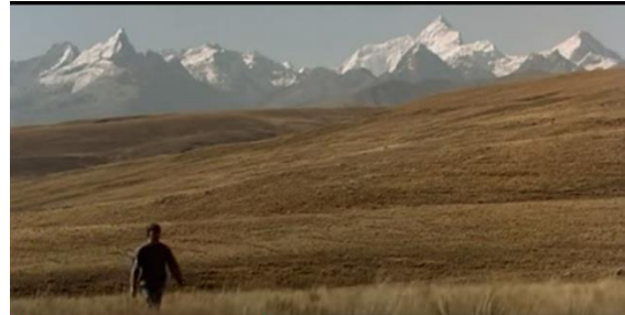
Fotografía 4. El ambiente andino peruano

Como otra característica aparece la lengua quechua que en algunos momentos es hablada. Aunque la primera lengua es la española, el quechua no está olvidado en la película. Los cantos que canta Madeinusa son mayoritariamente en quechua, la gente del pueblo habla quechua. Vilanova dice acerca de las lenguas habladas en la película lo siguiente (2014: 354):