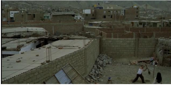
Fotografía 1. La periferia de Lima