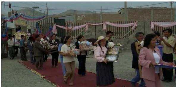
Fotografía 3. Los regalos para los novios

Las costumbres de los indígenas acerca de las bodas aparecen como otra característica del indigenismo en la película. Aunque viven en miseria y no tienen bastante dinero, las bodas tienen que ser lujosas. Se invita a mucha gente, se baila mucho y se compran los regalos. Una costumbre bastante interesante es que la novia tiene que pelar la patata de una vez y si lo hace bien, su vida sería larga y buena, justo como dice el padre de Máxima o tío de Fausta: Será una vida larga, llena de amor y esperanza.