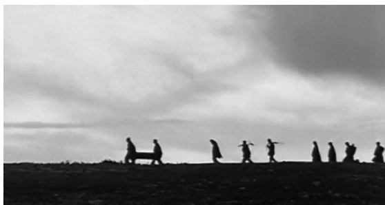
Fotografía 4. Funeral de Sabina

Como otra característica del indianismo en la película, aparecen las costumbres de los indígenas: el funeral de Sabina, la oración del pueblo a los dioses para que se vaya la tormenta y la lluvia, la conversación entre los hombres del pueblo sobre el asesinato de Sabina, el trabajo colectivo en el campo.