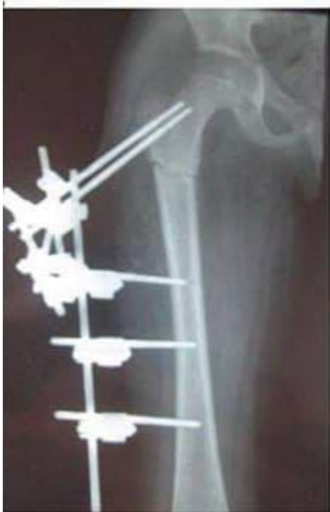
Slika 3. Rendgenski prikaz vanjske fiksacije zgloba kuka ( preuzeto sa: https://benthamopen.com/FULLTEXT/TOORTHJ-11-353/FIGURE/F1/ datum pristupa: 03.11.2018.)

Kod prijeloma kuka, pertrohanterni prijelom se liječi operacijski. Zbog vrlo visoke dobi pacijenata potrebna je potpuna prijeoperacijska priprema koja zahtjeva specifična znanja i vještine. Vrsta osteosinteze se odabire na temelju oblika prijeloma, biološke starosti bolesnika te njegove pokretljivosti prije prijeloma. Najčešće se koriste implantanti koji omogućavaju stabilnost prijelomne pukotine: kutna ploča, dinamička kompresivna ploča, gama čavao i proksimalni ukrivljeni čavao. (10) Na slici 4 prikazana je rendgenska snimka postavljenog gama čavla. Dan nakon operativnog zahvata započinje se sa mobilizacijom pacijenta radi sprječavanja postoperativnih komplikacija i komplikacija dugotrajnog ležanja.