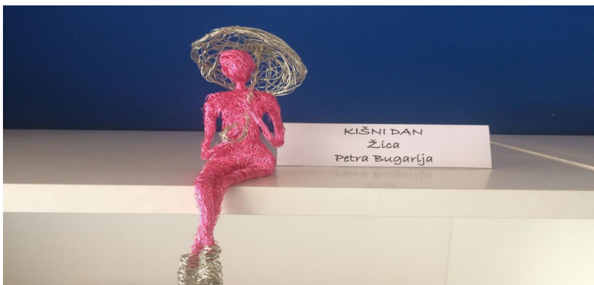
Slika 32. Detalj s izložbe „Naš kutak“