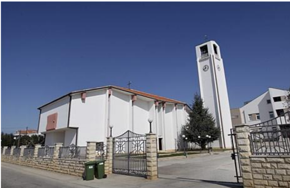
Slika 9. Crkva Uznesenja BDM