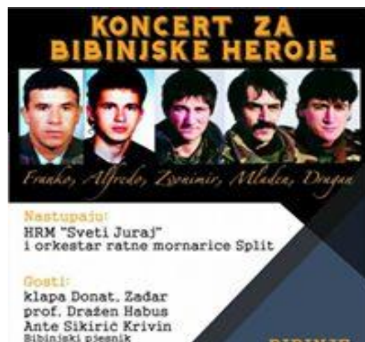
Slika 30. Plakat za koncert (preuzeto sa ebininje.net )