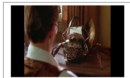
Slika 5: Prizor iz filma

Filmski se kritičari većinom slažu oko toga kako je, misleći prvenstveno na „fantazmagorijske vizije“ te odliku sekundarnosti radnje (Jaehne i Cronenberg 1992: 2) kao jedne od najreprezentativnijih obilježja umjetničkoga stvaranja, upravo kanadski redatelj, producent, scenarist i glumac David Cronenberg bio idealan izbor za postupak ekranizacije Burroughsova Gologa ručka . 15 Već se u njegovim prvim filmskim ostvarenjima (dugometražni filmovi Stereo 1966 i Zločini budućnosti 1970) uviđa „sklonost prema hororu, znanstvenoj fantastici, seksualnim nastranostima i morbidnim izrazima psihičkih poremećaja“. Nedugo zatim Cronenberg postaje jedan od najzvučnijih imena kanadske režije, a uz Goli ručak (1991) iz filmskoga opusa valja izdvojiti, prema Gilić (2003), Muhu (1986), Uklete blizance (1988), M. Butterfly (1993), Zonu smrti (1983), Videodrom (1983), Sudar (1996). U jednom od brojnih intervjuua na temu suradnje s Williamom Burroughsom i konkretno na pitanje Burroughsova utjecaja u procesu snimanja filma Cronenberg odgovara kako njegov filmski uradak 16 nastaje kao „produkt sna“; naime, Burroughs nije imao gotovo ništa sa samim procesom, već film prvenstveno nastaje kao Cronenbergovo viđenje Burroughsa i njegove knjige: