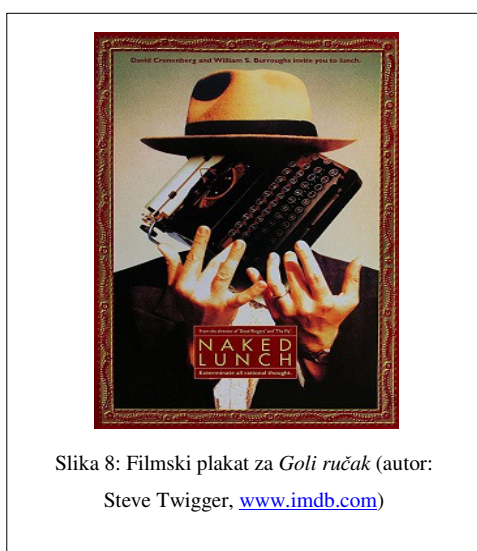
Slika 8: Filmski plakat za Goli ručak (autor: Steve Twigger, www.imdb.com )