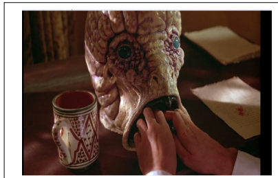
Slika 4: Prizor iz filma, www.youtube.com