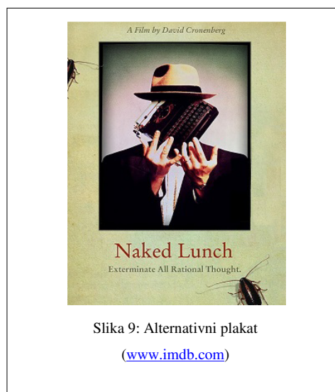
Slika 9: Alternativni plakat ( www.imdb.com )

U središtu službenoga filmskoga plakata Cronenbergova Gologa ručka nalazi se lik muške osobe (na što upućuju šešir, odijelo, izgled ruku) koja na mjestu glave (umjesto lica) ima