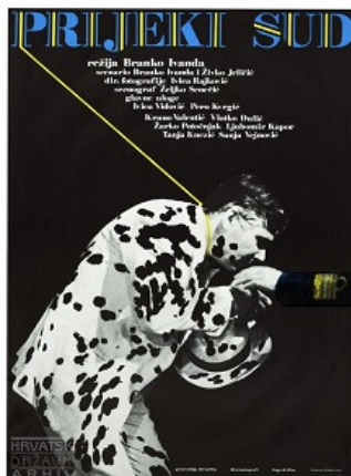
Slika 6: Filmski plakat za Prijeki sud (autor: Boris Bućan, www.arhiv.hr )

Pretapanje je uočljivo i u filmskim izražajnim sredstvima kao i u verbalnim izrazima. Plakat filma Prijeki sud utemeljen je na vizualnom pretapanju oblika i osobina čovjeka i psa. Na crnoj se podlozi nalazi centralno smješten lik odjeven u bijelo odijelo oslikano crnim točkama koji, u položaju blagog naklona, ljubi ruku nepoznatog pojedinca. Sudeći po obilježju rukava ljubljene ruke, vlasniku ruke bi se lako pripisala uloga autoriteta, državnoga tijela, odnosno autoritarnog predstavnika prijekoga suda. Osim toga, i sam čin naklona i poljupca čin je poniznosti spram onoga čija se ruka ljubi. Ta se „poniznost“ dodatno osigurava vizualno upečatljivom žutom uzicom 20 koja se nalazi oko vrata čovjeka u odijelu, a koja se proteže od samoga naslova plakata. Ta uzica kao da proizlazi iz usko odškrnutih vrata te, bez obzira na tamu crnila, pronalazi svoje odredište, čovjekov vrat. Autoritativna, stabilna, koso postavljena uzica oko vrata, čovjekov položaj tijela, a ponajviše izgled (točkaste) odjeće u promatračevu umu kreiraju sliku psa dalmatinca koji poslušno ljubi gospodarevu ruku. 21 Tim se likovnim sadržajem uspostavlja vizualna analogija čovjeka (lika iz filma i romana, koji je regionalno obilježen kao Dalmatinac) i pasmine psa s kojom taj regionalni etnonim dijeli ime. Uz