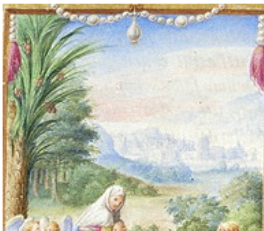
Slika 15 Časoslov Farnese, detalj fol.42v Bijeg u Egipat