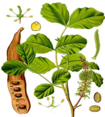
Slika 1. Ceratonia siliqua L.

Plod rogača (Slika 1.) je 12-20 cm duga, žilava i kožasta mahuna s mekanim, slatkastim i ponešto oporim mesom koji kasnije otvrdne.