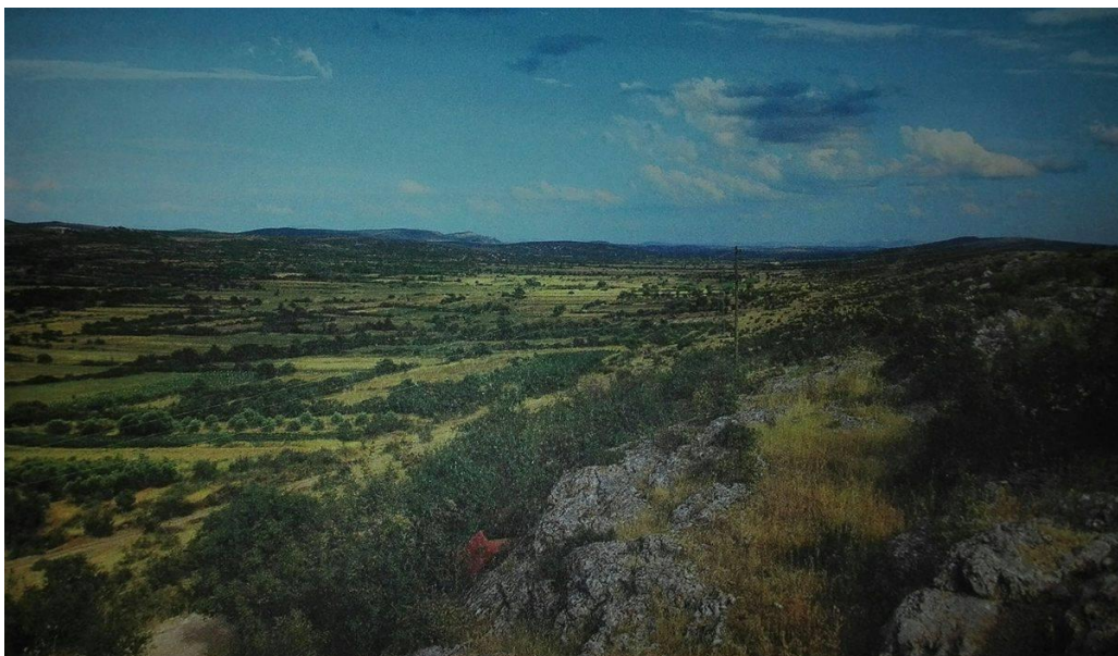
Slika 3. Obradive površine u Ravnim kotarima