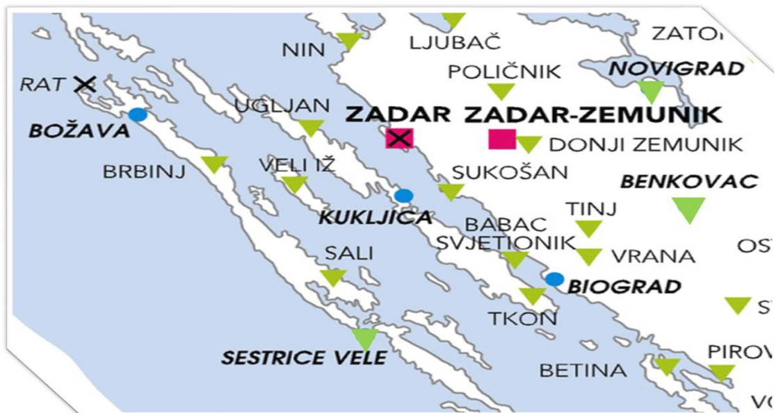
Slika 4. Meteorološke postaje Zadarske županije

U svrhu provjere naših ciljeva rada bilo je potrebno pribaviti meteorološke podatke s postaja u Zadarskoj županiji. Postaje koje smo odabrali za prikupljanje podataka jesu: Zadar-Zemunik, Zadar (grad), Biograd, Kukljica i Božava. Raspored meteoroloških podataka prikazan je na slici 4. iz dijela karte Zadarske županije. Grad Zadar, i Zadar-Zemunik označeni su ljubičastim kvadratićem, a Božava, Biograd i Kukljica plavim krugom, ostale meteorološke postaje s kojih nismo uzimali podatke označene su obrnutim zelenim trokutom.