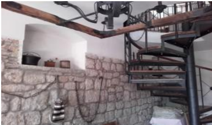
Slika 14. Unutrašnjost restorana „Tvrđava“