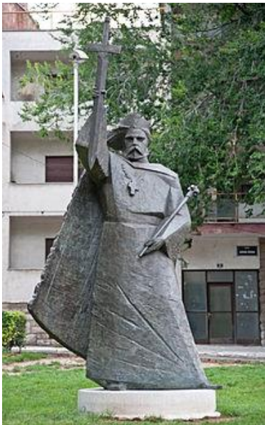
Slika 2. Kip kralja Zvinimira