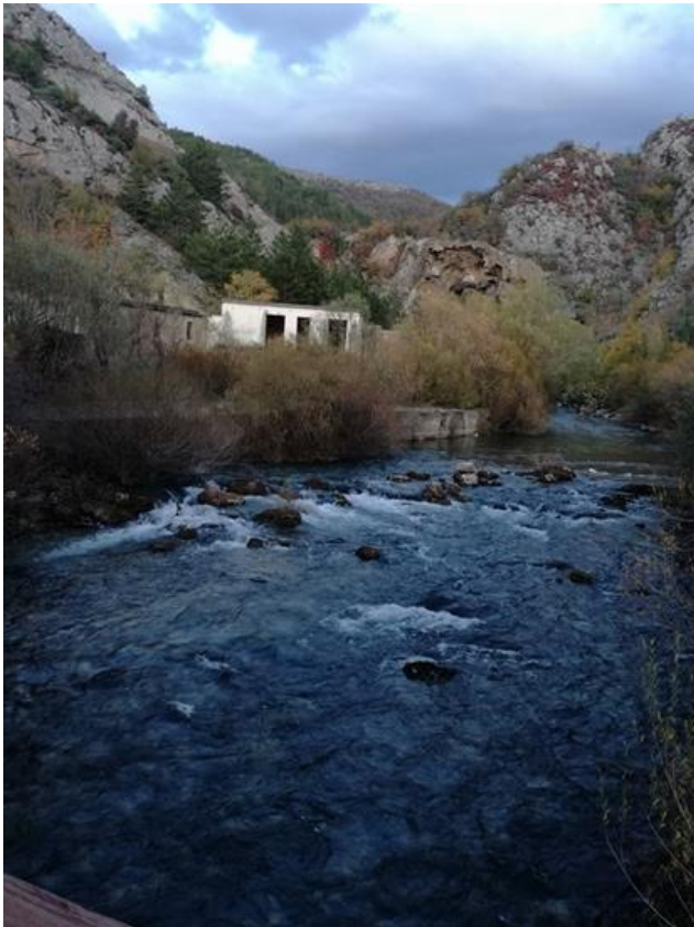
Slika 16. Trenutno stanje postojećeg devastiranog objekta