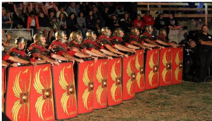
Slika 12. Prizor s Burnumskihida