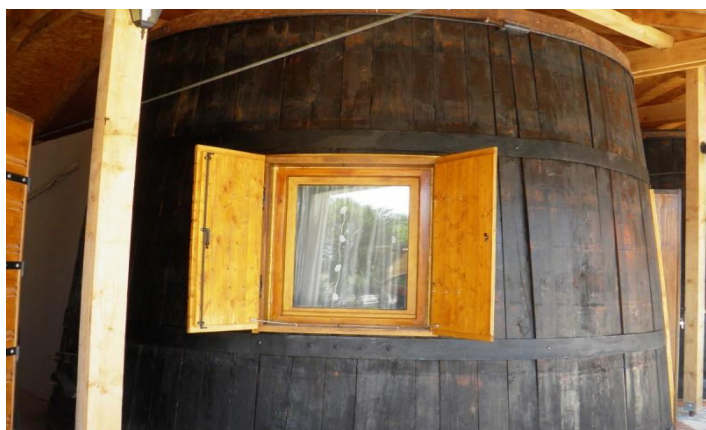
Slika 13. Fotografija sobe na OPG-u Duvančić