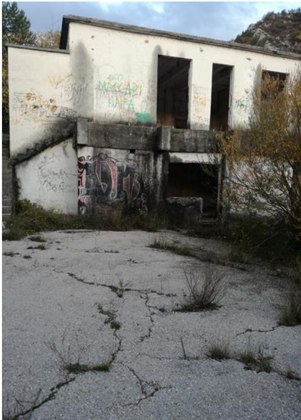
Slika 17. Trenutno stanje postojećeg devastiranog objekta