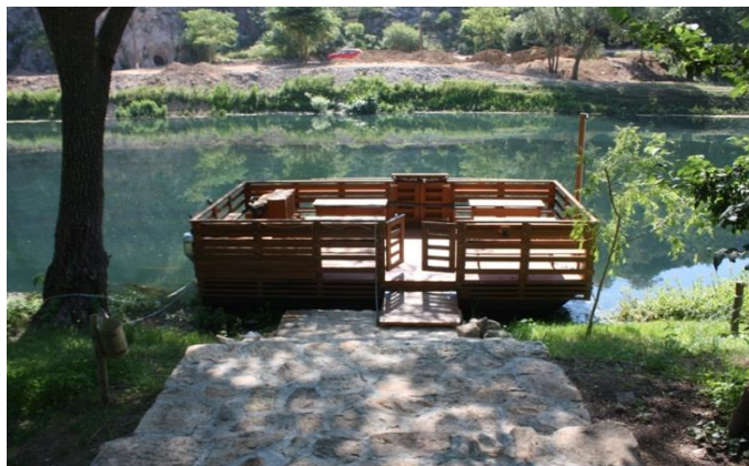
Slika 15. Splav kralj Zvonimir