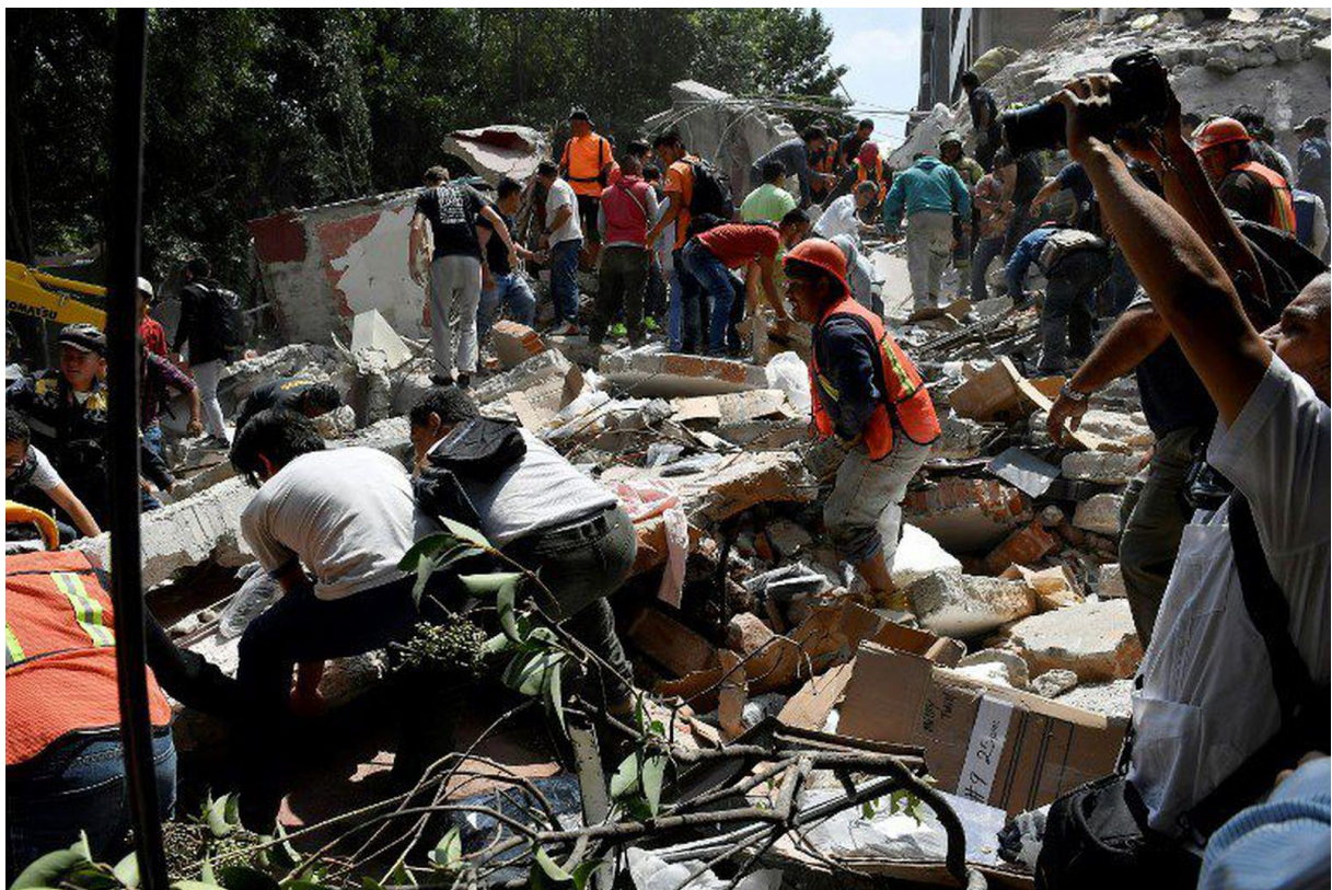
SLIKA 1. Prikazuje izvlačenje ljudi ispod ruševina nakon potresa u Meksiku (2).

Slika 1. prikazuje posljedice potresa koji se dogodio 19.09.2017godine. Razarajući potres u Meksiku dogodio se na 32 godišnjicu potresa iz 1985 god. Potres se dogodio samo nekoliko sati nakon što su stanovnici sudjelovali u vježbi za slučaj potresa, što uobičajeno čine 19. Rujna na godišnjicu potresa. Potres jačine od 7,1 stupanj., razorio je grad uz mnogobrojne ljudske žrtve. U urušavanju škole poginulo je dvadeset i jedno dijete. Materijalne štete su velike (2).