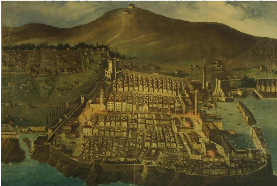
Prilog 2: Dubrovnik prije potresa 1667.