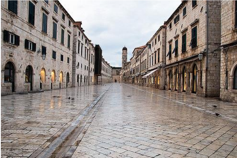
Prilog 5: glavna gradska ulica Placa (pogled s istoka)