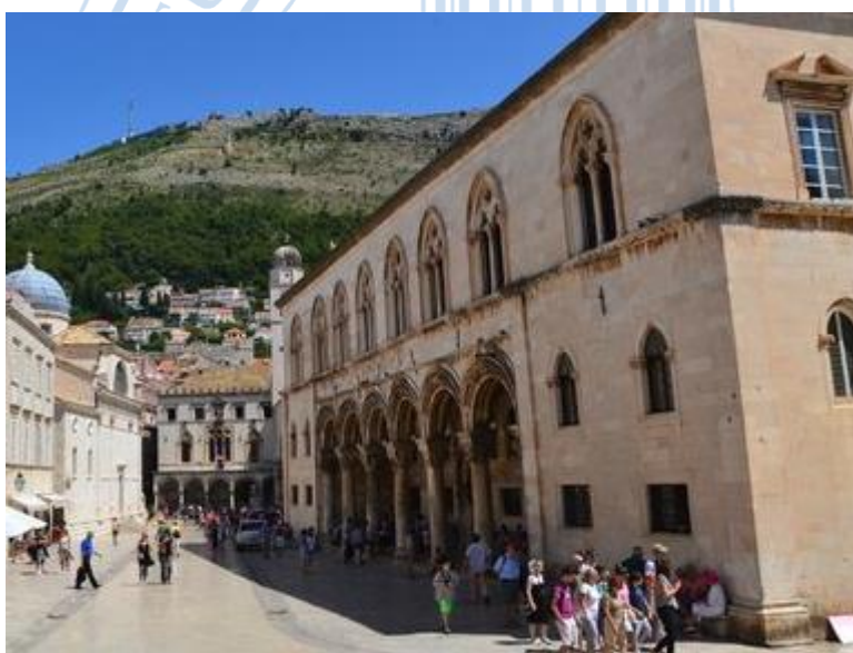
Prilog 4: ulica Pred dvorom, Knežev dvor desno i palača Sponza na kraju ulice