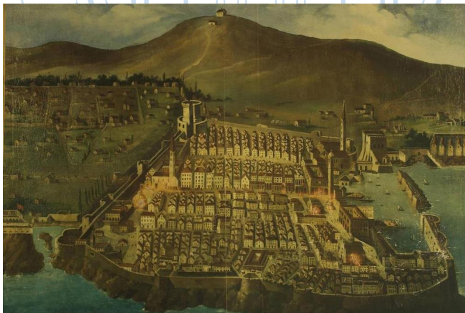
Prilog 2: Dubrovnik prije potresa 1667.