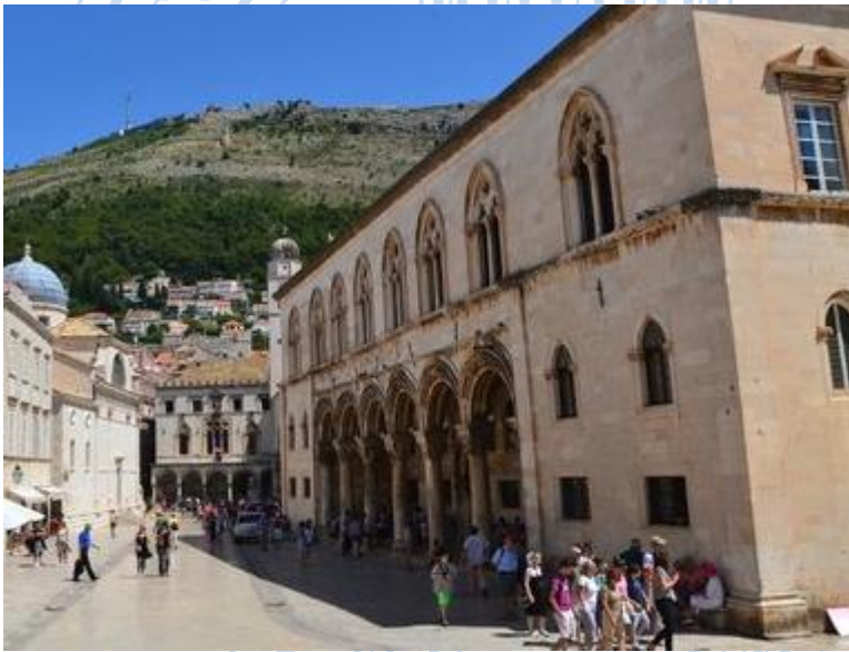
Prilog 4: ulica Pred dvorom, Knežev dvor desno i palača Sponza na kraju ulice