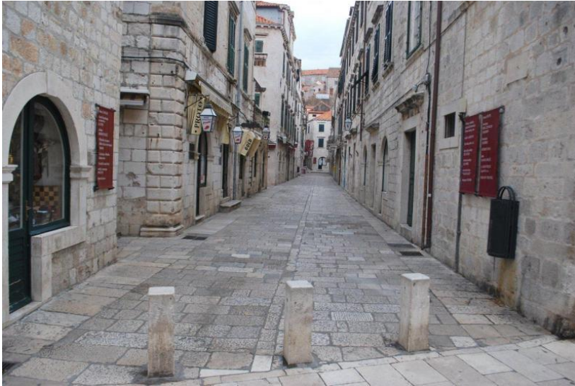
Prilog 3: Široka ulica, nepostojanje vanjskih stubišta