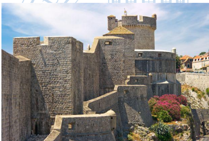
Prilog 8: Gradske zidine, spoj srednjovjekovnih i renesansnih

Prilog 1: Tlocrt Dubrovnika; Beritić, Lukša: Ubikacija nestalih građevinskih spomenika u Dubrovniku, Prilozi povijesti umjetnosti u Dalmaciji , 10., 1956., 15.-83.