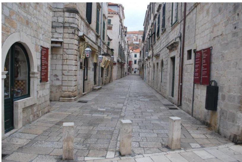
Prilog 3: Široka ulica, nepostojanje vanjskih stubišta