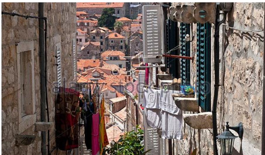
Prilog 7 : Kameni zubovi pod prozorima