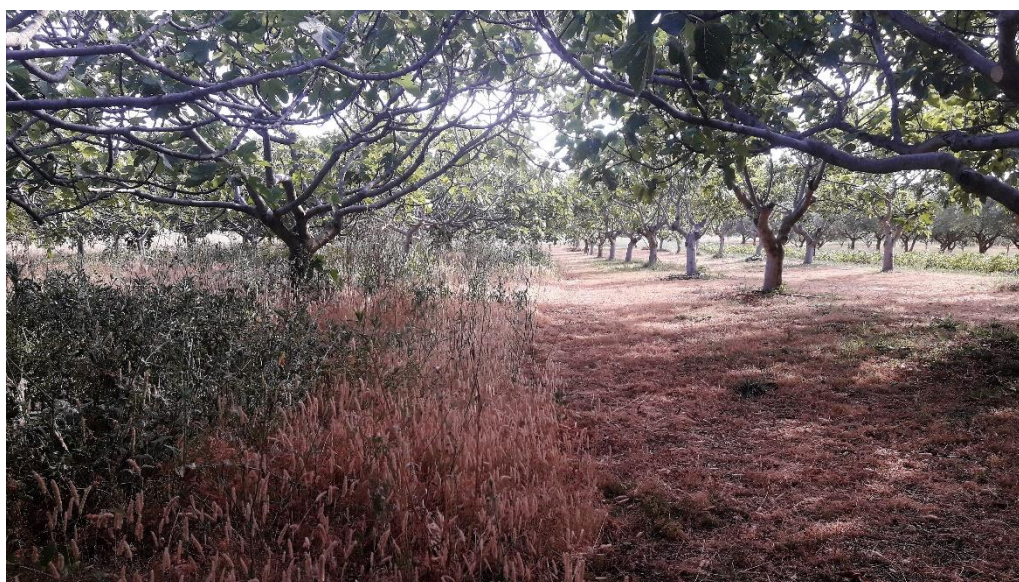
Slika 1. Zakorovljeni i pokošeni (malčirani) dio nasada

Istraživanje je provedeno na području Ravnih kotara (Polača) u nasadu smokve OPG-a Ražnjević. Ravni kotari pripadaju submediteranskoj klimatskoj zoni Cfa (umjereno topla vlažna klima s vrućim ljetima) prema Koppenovoj raspodjeli klimatskih tipova. Tlo u nasadu je smeđe tlo na vapnencu koje je dominantno u Zadarskoj županiji te je prisutno na 33.3 % površina (Husnjak,2014.). Nasad je star 15 godina. Način proizvodnje je integriran, a prostire se na površini od 1 ha. Sustav za navodnjavanje je po modelu „kap na kap“. Površina je zatravljena (prepuštena samonikloj korovnoj flori) i održava se košnjom. Gnojidba proljetna i zaštita u nasadu nisu primjenjivane u vegetacijskoj sezoni kad je obavljen pokus. Vodeća sorta je jednorotka Zamorčica, a uz nju su još prisutne Petrovača bijela i Bjelica koje su dvorotke. Razmak sadnje u nasad je 6 x 6 m, uzgojni oblik je vaza sa tri do četiri skeletne grane.