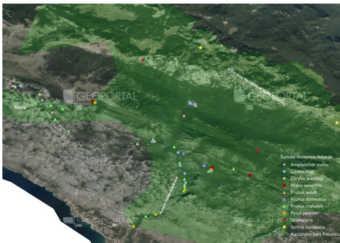
Slika 1. Karta mapiranih opisanih šumskih voćkarica u NP Paklenica

U daljnjem tekstu opisana je morfologija pojedinih voćkarica na prostoru NP Paklenica, a podaci su prikupljeni iz knjige "Dendrologija" autorice Marilene Idžojić, u kojoj su detaljno opisane osobine svake voćkarice, te je korištena internetska stranica http://www.plantea.com.hr/ . S ciljem dobivanja informacija o pojedinim lokalitetima ovih biljnih vrsta razgovaralo se sa stručnim osobama u Parku nakon čega je uslijedio obilazak terena u svrhu prikupljanja fotografija i izrade karte lokaliteta za svaku mapiranu šumsku voćkaricu prikazane Slikom 1.