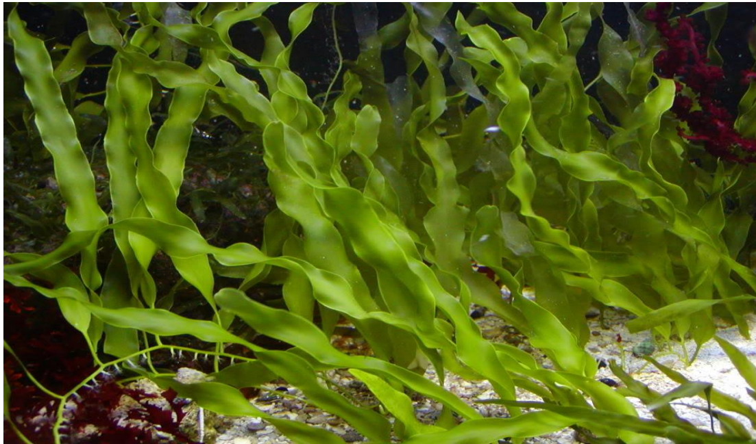
Slika 1. Autohtona C.prolifera

naša autohtona vrsta. Caulerpa prolifera (Forsskål) J.V.Lamouroux je zelene do tamno zelene boje. Najčešće se nalazi na plitkim i pjeskovitim dnima. Ova zavičajna alga u Jadranu je rijetka pa njezin pronalazak ima iznimnu vrijednost. Jedino nalazište ove alge u Jadranu je u podmorju otoka Lokrum, gdje je zabilježena krajem 2004. godine (Žuljević A. 2005.).