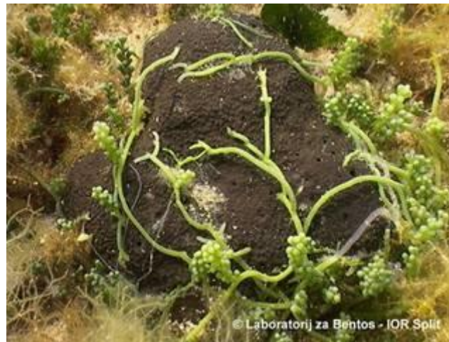
Slika 6. Parazitiranje C.racemosa na morskoj spužvi

gustoća algi u Jadranu izmjerena je u Vrsaru (Sjeverni Jadran) s oko 32.000 listova i 1.200 m stolona na m 2 , te na Paklenskim otocima (Srednji Jadran) sa 27.000 listova i 2.600 m stolona na m 2 (Žuljević A. i sur., 2011.). U unutrašnjosti gustog spleta stabalca dolazi do akumulacije anorganskih čestica sedimenta i organske tvari, te biološkom razgradnjom dolazi do povećane potrošnje kisika što ponekad dovodi i do anoksije koja je smrtonosna za većinu organizama. C.racemosa se vrlo lako razvija na morskim spužvama jer joj za rast koriste ekskreti spužve koje iskorištava kao hranjive tvari a spužva počinje ugibati. Biološkom razgradnjom spužve i oslobađanjem hranjivih soli potiče se daljnji rast alge. Spužva promjera 10 cm bila je zahvaćena sa 31 metrom stabalca dok je alga imala miris na sumporovodik i bila u potpunosti nekrotična. Bijeli sloj anoksičnih bakterija Beggiatoa spp. je često vidljiv ispod stolona na spužvama potpuno prekrivenim C. racemosa (Žuljević A. i sur., 2011.).