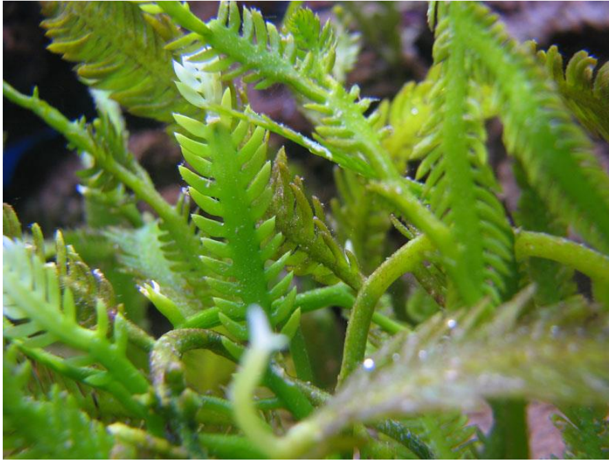
Slika 2. Caulerpa taxifolia

Caulerpa taxifolia zasad u Jadranu pronađena je jedino na tri lokacije: Starogradski zaljev kod otoka Hvara, kod Malinske na otoku Krku i u Barbatskom kanalu između otoka Raba i otočića Dolin kako je i prikazano na slici 3.