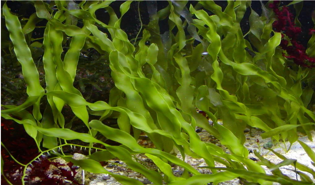
Slika 1. Autohtona C.prolifera

naša autohtona vrsta. Caulerpa prolifera (Forsskål) J.V.Lamouroux je zelene do tamno zelene boje. Najčešće se nalazi na plitkim i pjeskovitim dnima. Ova zavičajna alga u Jadranu je rijetka pa njezin pronalazak ima iznimnu vrijednost. Jedino nalazište ove alge u Jadranu je u podmorju otoka Lokrum, gdje je zabilježena krajem 2004. godine (Žuljević A. 2005.).