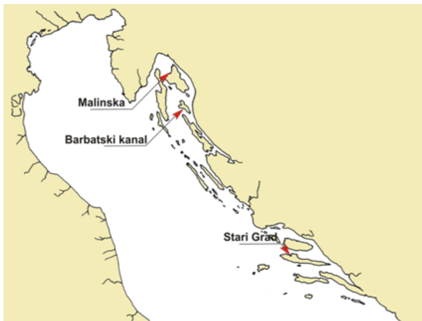
Slika 3. Nalazišta C. taxifolia u Jadranu 2008. g.

Caulerpa taxifolia zasad u Jadranu pronađena je jedino na tri lokacije: Starogradski zaljev kod otoka Hvara, kod Malinske na otoku Krku i u Barbatskom kanalu između otoka Raba i otočića Dolin kako je i prikazano na slici 3.