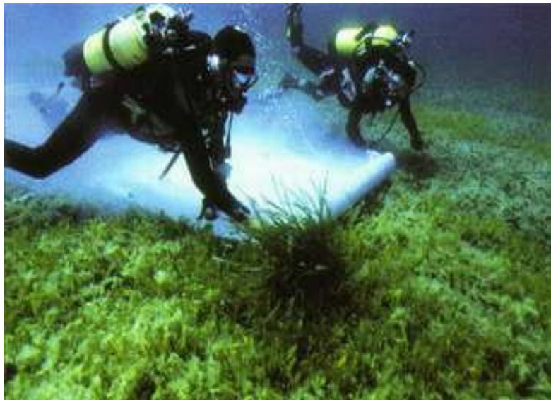
Slika 8. Uklanjanje algi iz roda Caulerpa nanošenjem bakrenog sulfida

stručnjaci mogu suzbiti. Najugroženiji je južni Jadran, jer se nalazi na putanji ulaznih struja koje su jedan od glavnih načina širenja ovih algi. Uklanjanje ovih vrsta je težak posao koji bi se isključivo trebao odvijati uz odobrenje nadležnih organa i prisutnost stručnjaka. Bilo kakvim rukovanjem i neznanjem, ove alge se veoma brzo prenose i šire od već napadnutih mjesta na nova područja ( ikorculainfo.com ).