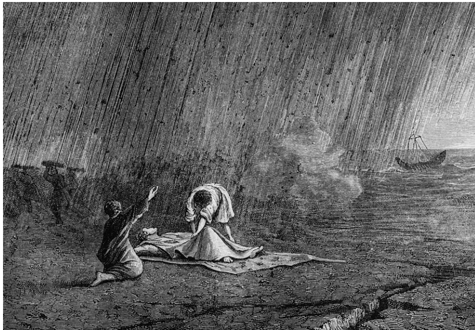
6. Prikaz smrti Plinija Starijeg 6