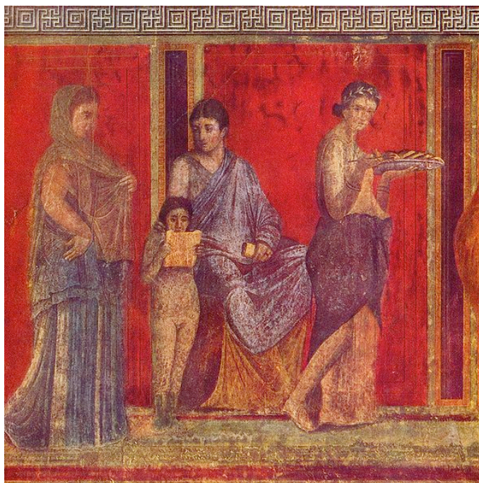
3. Dio freske iz Vile misterija 3

Danas postoje različite interpretacije te serije likova u prirodnoj veličini ( megalographia ). Jedna interpretacija tumači prikaz inicijacije neke žene u orfičke ili dionizijske misterije dok druga čita predstavljanje drame povezane s epizodama iz Dionizova života. Paul Veyne, kao najnoviju interpretaciju, «predlaže čitanje ciklusa kao slijeda priprema za vjenčanje djevojke iz dobre obitelji i slavljenja bračne ljubavi na čiji ideal aludira središnji par, Dioniz u naručju Ariadne» (Borriello et al., 2011:128).