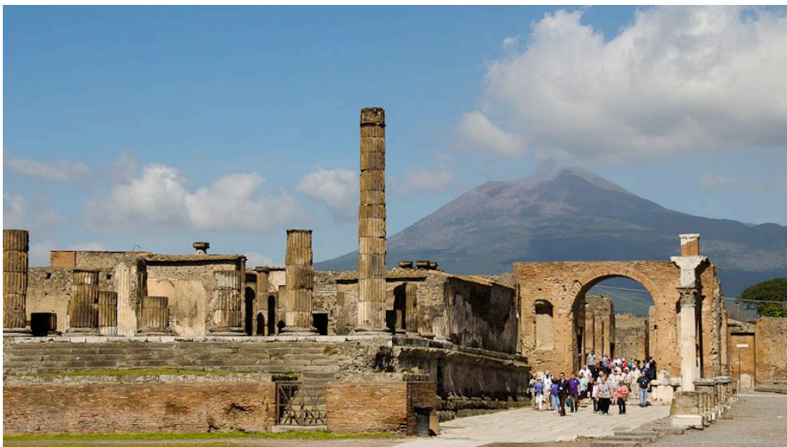
2. Pogled na Vezuv s Foruma 2

U rimskoj državi svaki grad je imao prostor za forum. Na forumu u Pompejima mogu se vidjeti razna svetišta i javne građevine koje su nastale u ranom rimskom carstvu. Posebnost ovog foruma je u tome što pročelja građevina nisu okrenuta prema trgu, nego dvokatni trijemovi sa stupovima obilaze trg oblikujući jedinstven otvoreni prostor (Borriello et al., 2011:182).