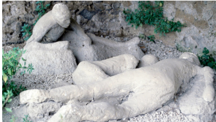
5. Odljevi pompejskih žrtava 5

Posjetitelji danas mogu vidjeti odljeve pompejskih žrtava erupcije u različitim položajima tijela, često rukama pokrivena lica jer su se najvjerojatnije htjeli zaštititi od vrućeg pepela i kamenja, te svjedočiti užasnoj smrti koja je 79. godine zadesila stanovnike (Borriello et al., 2011:159).