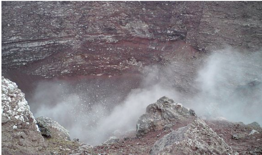
4. Krater Vezuva 4

U trenutku provala vulkana Vezuva, drugi grad Herkulanej, bio je pet puta manji od Pompeja. Došao je pod rimsku vlast 89. godine pr. Kr. te je bio omiljeno ljetovalište rimskih patricija zbog svoje prirodne ljepote, blaga i zdrava podneblja. O tome da je Herkulanej bio ljetovalište uglavnom bogatih Rimljana svjedoči raskošna palestra na istočnom kraju grada, s velikim bazenom za plivanje i kazalištem koje je građeno u doba rimske vladavine, s raznobojnim mramornim pročeljem, te brojnim brončanim i mramornim kipovima careva i državnih službenika, koji se danas nalaze u raznim muzejima izvan Italije (de Simone, Verchi, 1983:155).