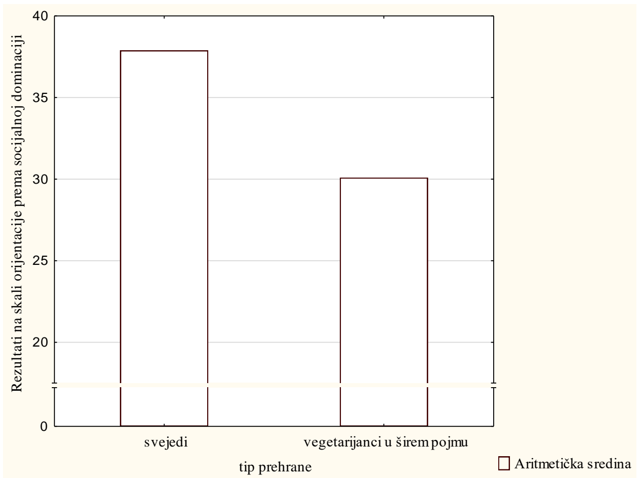
Slika 1 Prikaz rezultata na skali orijentacije prema socijalnoj orijentaciji s obzirom na tip prehrane