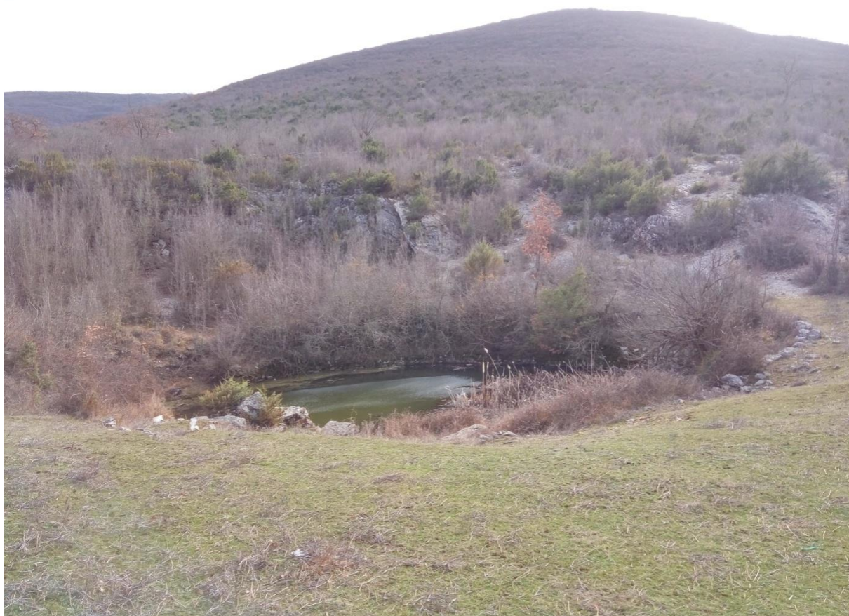
Slika 11 – Lokva Roženjača

Lokva Roženjača smjestila se 2 kilometra zapadno od lokve Kosmać u podnožju brdskog masiva Praća. Nalazi se u manjoj vrtači površine 130m 2 . Obložena je suhozidom, a prirodni joj je ulaz bio sa sjeverne strane. Zanimljivo je primijetiti nedostatak zidanih bunara kao na svim drugim lokvama u selu, što se može protumačiti činjenicom kako u bližoj okolini nema zaseoka. Pregledavajući austrijske karte iz sredine XIX. st. može se vidjeti put koji je vodio preko lokve i brda sve do Vidove gradine u susjednoj Prapatnici. Postoji mogućnost da su lokva i gradina u korelaciji. U blizini lokve nalazi se polje koje je na Hrvatskoj osnovnoj karti označeno imenom „Zlopolje“ čiji naziv može upućivati na potencijali arheološki lokalitet, a ovaj naziv i danas koriste mještani obližnjeg zaseoka. U ogradama pokraj same lokve lako se mogu primijetiti veći kameni blokovi ugrađeni u suhozide čiji oblik neodoljivo podsjeća na poklopnice grobova (T. VII).