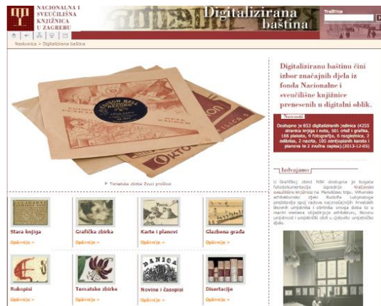
Slika 2. Početne stranice digitaliziranih zbirki u Hrvatskoj: 1) Spalatina, Gradska knjižnica Marka Marulića, Split; 2) Digitalizirana baština iz fonda Nacionalne i sveučilišne knjižnice, Zagreb.

Ministarstvo kulture 2005. godine imenovalo je 13 članova Radne skupine za digitalizaciju arhivske, knjižnične i muzejske (AKM) građe čija je zadaća bila izraditi prijedlog nacionalnog programa digitalizacije AKM građe. U okviru ovog prijedloga Radna skupina je prepoznala tri glavna zadatka: