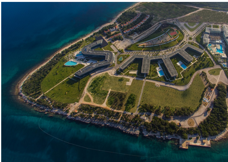
Slika7Zeleni resort Punta Skala, Petrčane

Osim toga, postoji i sustav za pročišćavanje otpadnih voda koje se čiste putem potpuno biološkog sustava za pročišćavanje i prikuplja zajedno s kišnicom i vodom iz bazena. Tako prikupljena voda koristi se za ispiranje WC-a i navodnjavanje zelenih površina.