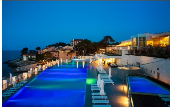
Slika5 Vitality Hotel Punta, Lošinj