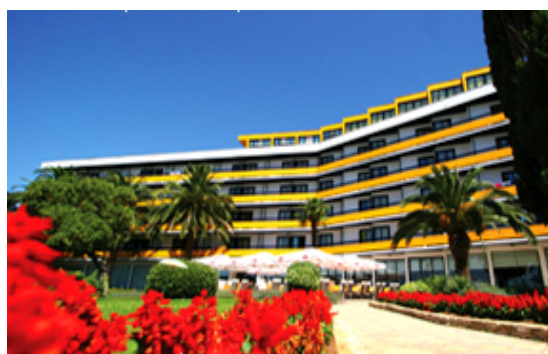
Slika4 Hotel Ilirija, Biogradnamoru