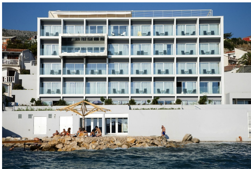
Slika 8 Hotel Split, Podstrana

„U razdoblju od 2002.–2008. u organizaciji Hrvatskog centra za čistiju proizvodnju provedeni su projekti čistije proizvodnje. U projektima je sudjelovalo 17 hotelsko–ugostiteljskih tvrtki s 19 hotela. Tijekom provedbe projekata predloženo je 93 različite mjere, čijom primjenom se ostvaruju financijske uštede od 6,2 milijuna kn. Investicije potrebne za provedbu svih mjera iznose 7,9 milijuna kn.